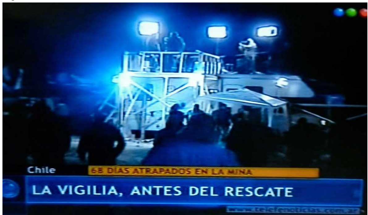
Momentos de alto contenido Simbólico (emisión del canal oficial Chileno, retransmisión de canales argentinos)