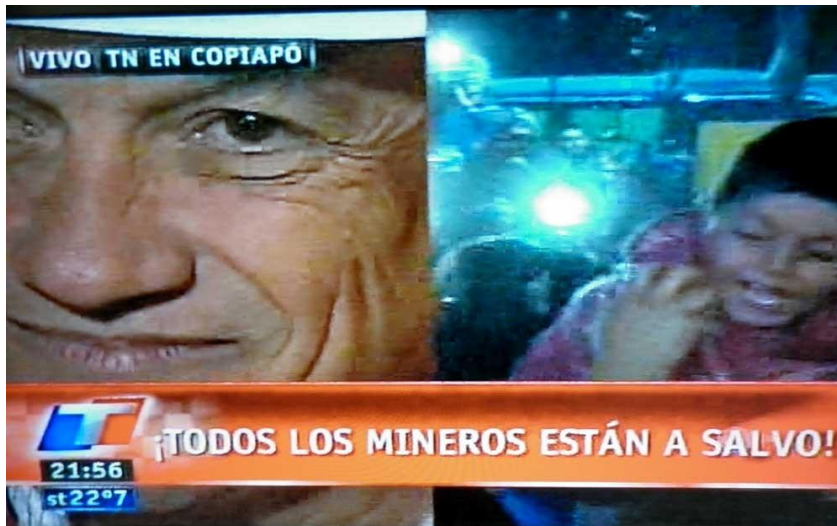
Cobertura de los días posteriores al rescate