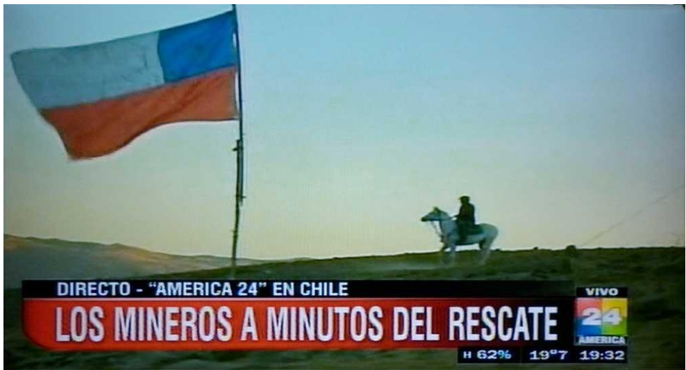
Imágenes del Rescate