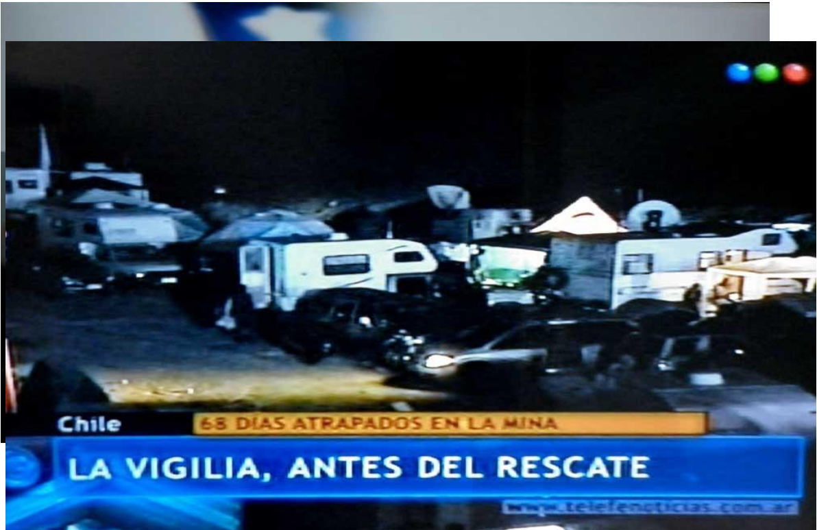
Vigilia de la noche anterior al rescate.