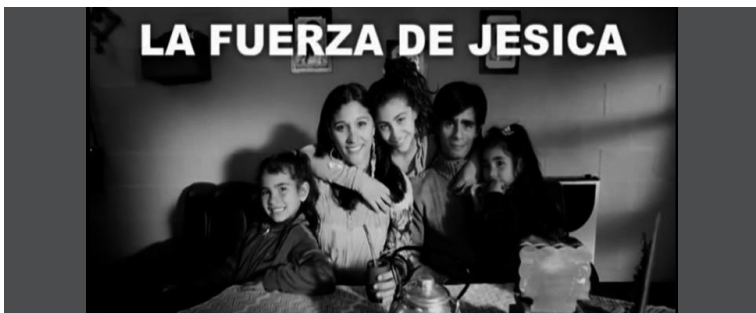
1. "La fuerza de" (aquí los nombres varían de acuerdo a cada spot).

La descripción de la secuencia final que comparten todos estos spots, producidos para las elecciones generales, es la siguiente: