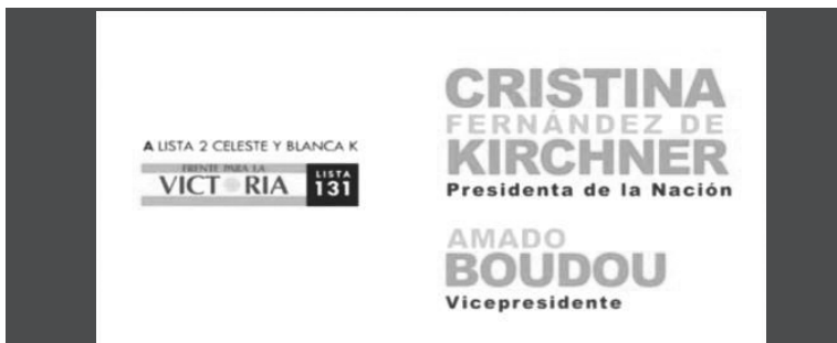
5. Fórmula electoral.

En la secuencia descrita se utiliza una imagen de Cristina Fernández de Kirchner vestida de blanco, mirado a una multitud de frente pero tomada por la cámara de espaldas. Todos los fragmentos elegidos para ilustrar los spots de esta campaña son imágenes de archivo, ya sea de actos donde participó Cristina Fernández de Kirchner durante su primer mandato o de acontecimientos significativos del gobierno –tanto del periodo 2003-2007 como del 2007-2011–. Al final de cada spot aparece la fórmula de campaña que, para las primarias de agosto la siguiente: “A lista 2