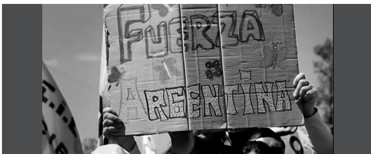
2. Distintas personas sosteniendo carteles con la inscripción "Fuerza Argentina".