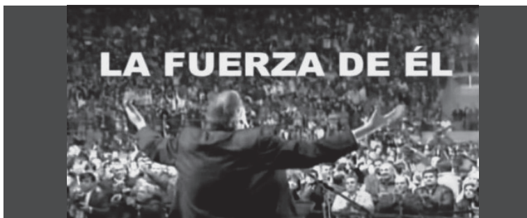
1. "La fuerza de" (aquí los nombres varían de acuerdo a cada spot).