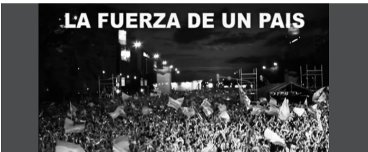
5. Imagen de una multitud agitando banderas y la inscripción: "La fuerza de un país"