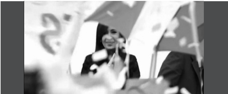
3. Cristina Fernández de Kirchner tomada por la cámara de frente, entre banderas y carteles que se interponen entre la cámara y su figura.