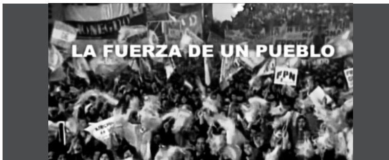
4. Imagen de una multitud agitando banderas celestes y blancas con la inscripción "La Fuerza de un pueblo".