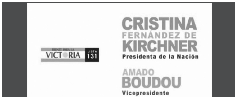
6. Fórmula electoral.

En los videos producidos para las elecciones generales la imagen elegida de Cristina Fernández de Kirchner resulta muy similar, ya que también se la puede ver de frente a una multitud y tomada por la cámara desde atrás, sólo que en esta oportunidad esta vestida de negro, no de blanco. Esta diferencia que se puede observar al final de cada spot, sumada a que el nombre de la lista es distinto, nos permite diferenciar a primera vista los videos producidos para las elecciones primarias de aquellos que fueron producidos para las generales de octubre, donde la fórmula electoral se redujo a: “Frente Para la Victoria. Lista 131. Cristina Fernández de Kirchner presidenta de la Nación. Amado Boudou vicepresidente”.