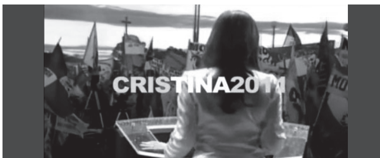
3. Cristina Fernández de Kirchner tomada por la cámara de espaldas frente a una multitud que la ovaciona con la inscripción "Fuerza Cristina" y luego "Cristina 2011".