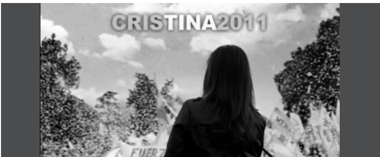
4. Cristina Fernández de Kirchner vestida de negro tomada por la cámara de espalda, de frente a una multitud con la inscripción "Cristina 2011".