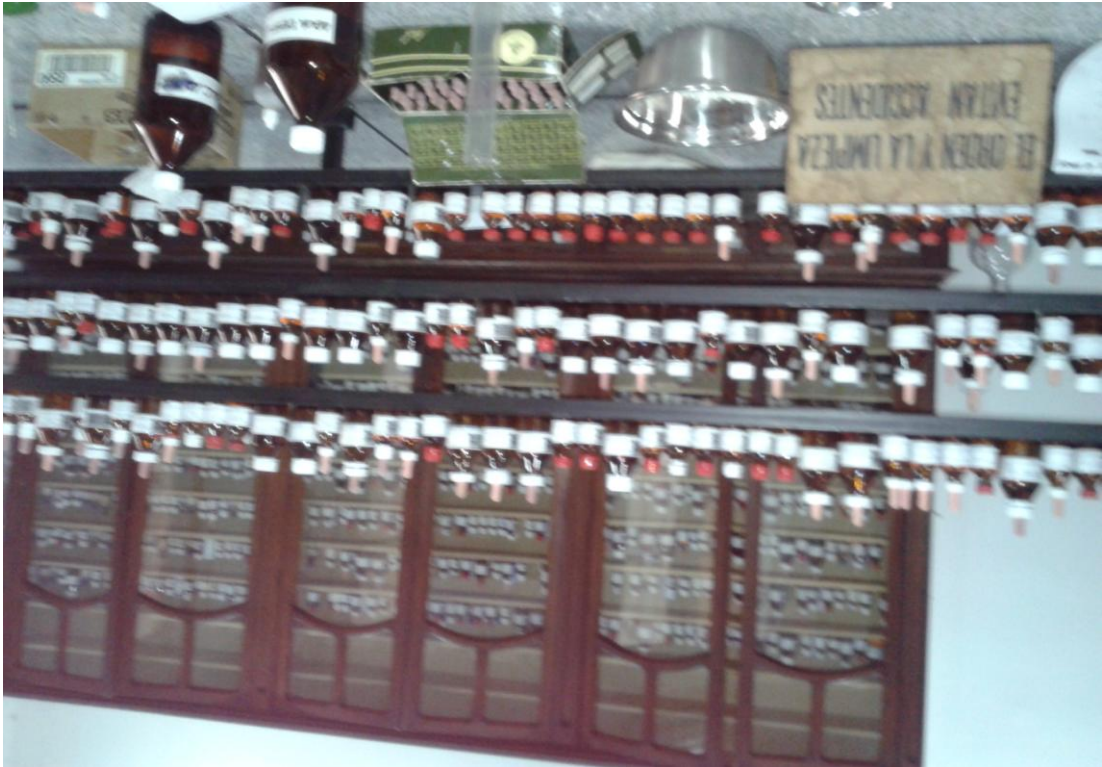
Imagen perteneciente al laboratorio de preparados homeopáticos de la Farmacia Argentina

Homeopática, de la ciudad de La Plata. En la imagen se observan los frascos que contienen los policrestos, ubicados en estantes sobre la mesada de trabajo para su rápido acceso.