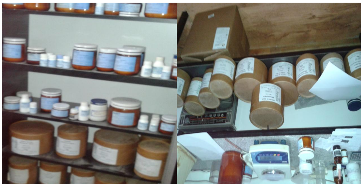
Imagen perteneciente al laboratorio de preparados magistrales alopáticos, de la Farmacia Homeopática Argentina de la ciudad de La Plata.

Encontramos otro laboratorio, para elaboración de preparados magistrales alopáticos con sus respectivos elementos y asepsia adecuada;