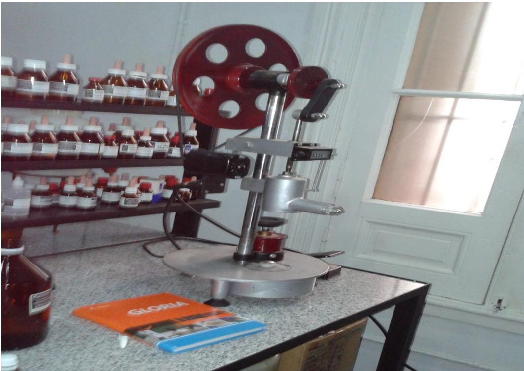
Dinamizador mecánico de la Farmacia Homeopática Argentina de la ciudad de La Plata, ubicado en la mesada del laboratorio de preparados homeopáticos, junto al estante de policrestos.

En ese mismo laboratorio se encuentran todos los elementos necesarios para elaborar los remedios homeopáticos, las tinturas y las diluciones se hallan ordenadas y etiquetadas en las diferentes vitrinas, antiguas y de madera, ubicadas en torno a la mesada.