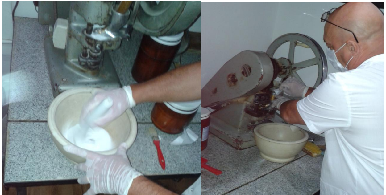
Imagen correspondiente al proceso de elaboración de preparados magistrales alopáticos. Allí se ve al director de la farmacia mezclando los elementos que indicaba la receta para proceder posteriormente a la elaboración mecanizada del comprimido.

El otro laboratorio que posee esta farmacia es el que se utiliza para la elaboración de preparados magistrales herbarios (los que se vinculan a la medicina tradicional). Estos preparados, al igual que los homeopáticos, se desarrollan a partir de las tinturas madres que elabora la propia farmacia.