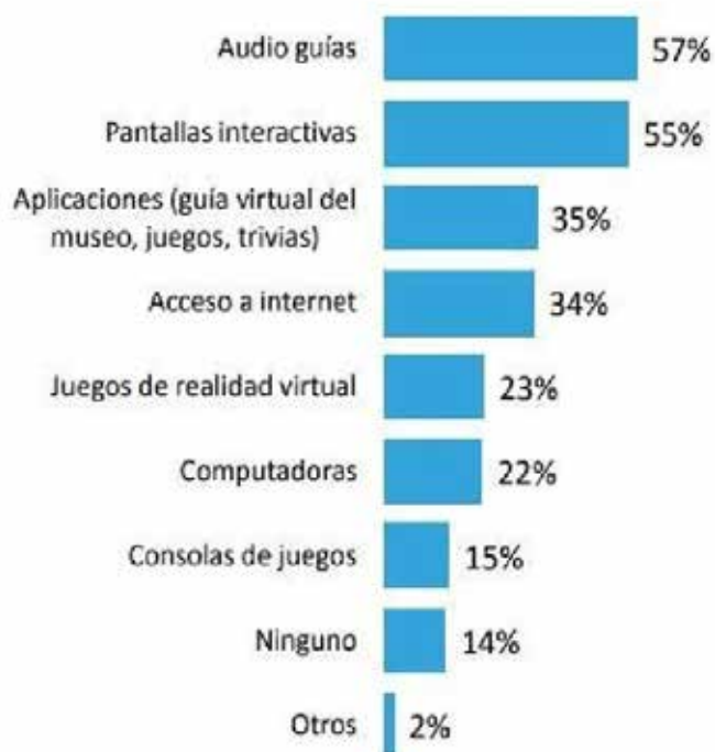
Gráfico N° 2: ¿Qué usos de tecnologías le parece relevante incorporar?