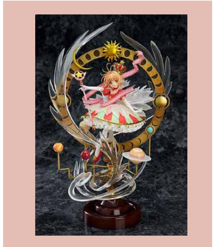
Fig. 7 Figura original de Sakura. Valor $20.900.