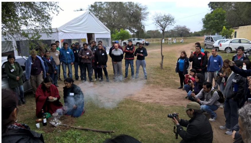
Figura 4. Ceremonia de apertura del IV Encuentro Nacional de RATuRC, en el camping El Chorro.