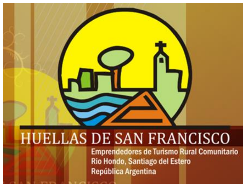
Figura 3. Logo del grupo Huellas de San Francisco. 13