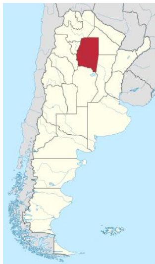
Figura 1. Localización de la provincia Santiago del Estero en Argentina. 11

En la provincia de Santiago del Estero se encuentra la ciudad Termas de Río Hondo, en el departamento Río Hondo, ubicada al noroeste de la ciudad de Santiago del Estero, aproximadamente a unos 65 km. sobre la Ruta Nacional 9. Debido a su localización y accesibilidad (a 83 km, de San Miguel de Tucumán, 442 km. de Córdoba y 1004 km. de Buenos Aires), Termas de Río Hondo recibe durante todo el año, turistas nacionales e internacionales.