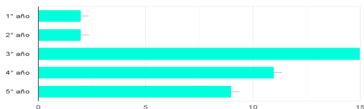
Figura 1: datos obtenidos de las encuestas realizadas a Licenciado en Enfermería recibidos de la Universidad Nacional Arturo Jauretche durante mayo del 2021.

¿Cuáles fueron los años según recuerda en donde curso las dos asignaturas correlativas relacionadas a la ética y deontología? 27 respuestas