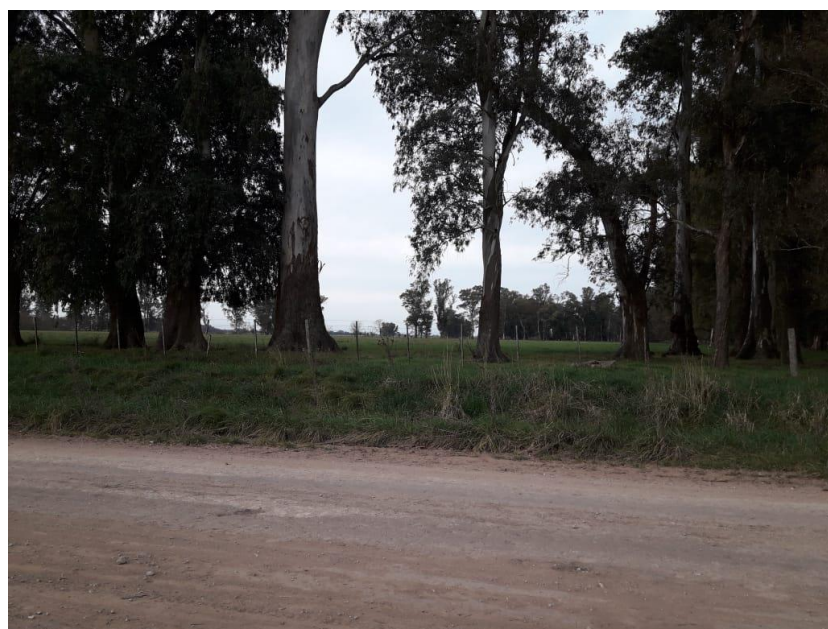
Dirección Cuartel III Camino A Cañuelas s/n Marre –General Las Heras Provincia de Buenos Aires.