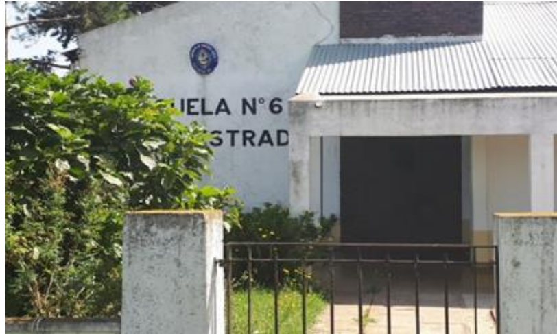
JIRIMM N° 1 y Escuela Primaria N°6 José Manuel Estrada, ubicada en el km. 76 de la Ruta 40, Paraje Granja Blanca.