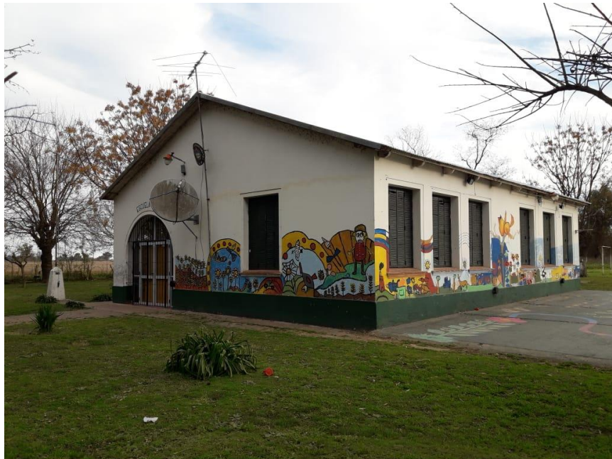
JIRIMM N° 7 y Escuela Primaria N° 10 Mariano Moreno