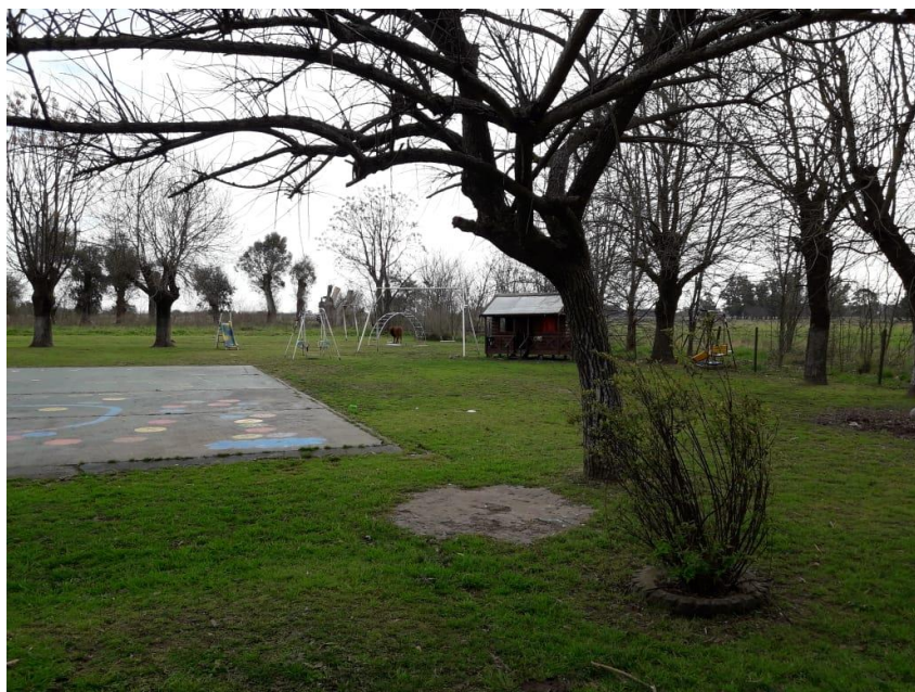
Parque de recreos y de juegos; espacio compartido por los alumnos del Nivel Inicial y del Nivel Primario.