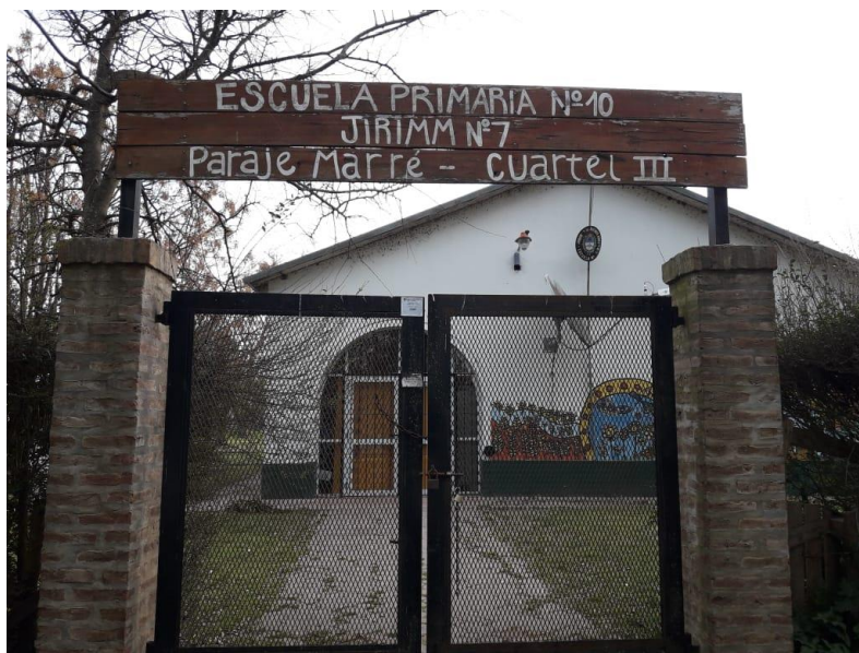
Puerta de ingreso a la Escuela Rural