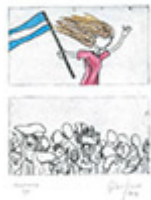
Ilustración de esta página: Lissa, S. (2021). Siempre en la lucha [grabado y aguafuerte coloreada a mano]. Programa de Cultura de la Secretaría de Extensión Universitaria de la Universidad Nacional de Quilmes, convocatoria artística “Imaginerías de una lucha”. Bernal: UNQ.

Recalde, A. (2021). La difusión de un relato de territorios narrados en pandemia. Las relaciones internacionales de Argentina a través de la prensa. En Investigar en pandemia [dossier]. Sociales y Virtuales , 8(8). Recuperado de http://socialesyvirtuales.web.unq.edu.ar/dossier/la-difusion-de-un-relato-de-territorios-narrados-en-pandemia/