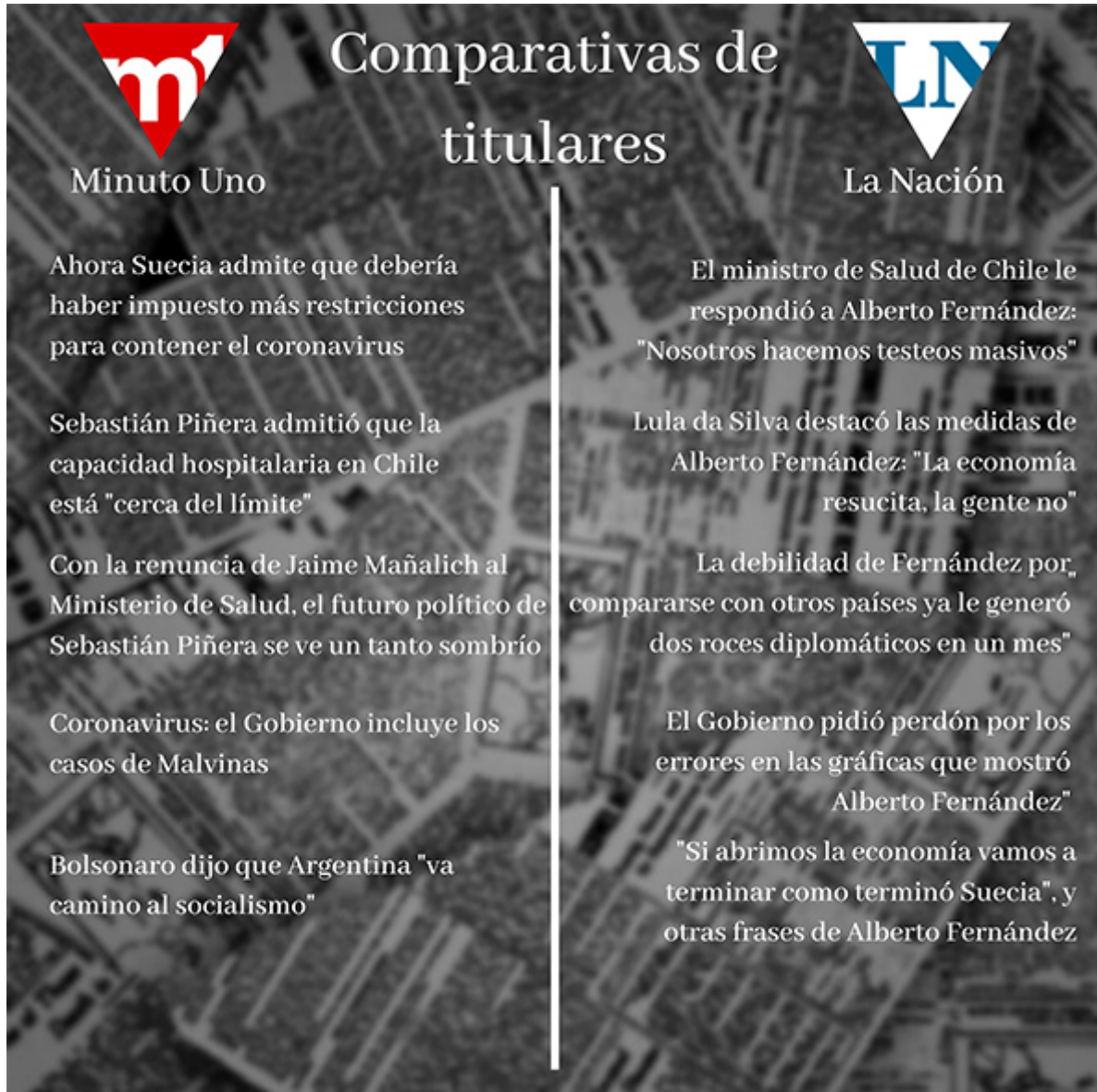
Comparativa de los titulares de los diarios La Nación y Minuto Uno. Clic en la imagen para ampliarla.

Estos fueron los principales sucesos relacionados a las noticias internacionales durante los primeros meses de la pandemia en el país. Para una mejor visualización de la construcción interesada e influencia por la ideología de los titulares de ambos diarios, se adjunta a continuación una imagen.