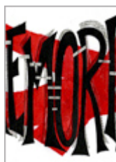
Ilustración de esta página: Damario, M. (2019). No es olvido (fragmento). [Técnica mixta]. En Programa de Cultura (Coord.) "Exposición 30 años, 30 obras". Bernal: Universidad Nacional de Quilmes. Clic en la imagen para visualizar la obra completa

Caraccioli, A. (2019). Las visiones del pasado desde los 30 hasta el 55. Sociales y Virtuales , 6(6). Recuperado de http://socialesyvirtuales.web.unq.edu.ar/dossier/las-visiones-del-pasado-desde-los-30-hasta-el-55/