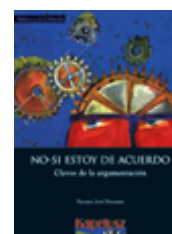
Ilustración de esta página extraída de: Durante, V. (1999). No-sí estoy de acuerdo: claves de la argumentación . Kapelusz, Buenos Aires.

Abdala, R. (2015). Aventuras y desventuras del Estado en la educación. O cómo se formó y reformó el sistema educativo en Argentina (1888 – 2010). Sociales y Virtuales , 2(2). Recuperado de http://socialesyvirtuales.web.unq.edu.ar/aventuras-y-desventuras-del-estado-en-la-educacion-o-como-se-formo-y-reformo-el-sistema-educativo-en-argentina-1888-2010/