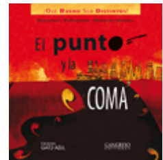
Ilustración de esta página extraída de: Pellegrino, M. I.; Nemitz, M. (2009) El punto y la coma . Cangrejo Editores, Bogotá.

Esperamos que cada vez sean más los lectores y escritores que participen de esta iniciativa para seguir construyendo, entre todos, un espacio de diálogo y reflexión que trascienda las aulas.