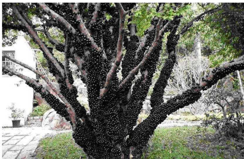
Figura 2. Árbol de jabuticaba ( Plinia cauliflora )

En el árbol se evidencian algunos de los matrimonios dobles que pudieron volcarse en el papel. Fotografía tomada durante el trabajo de campo, año 2017.