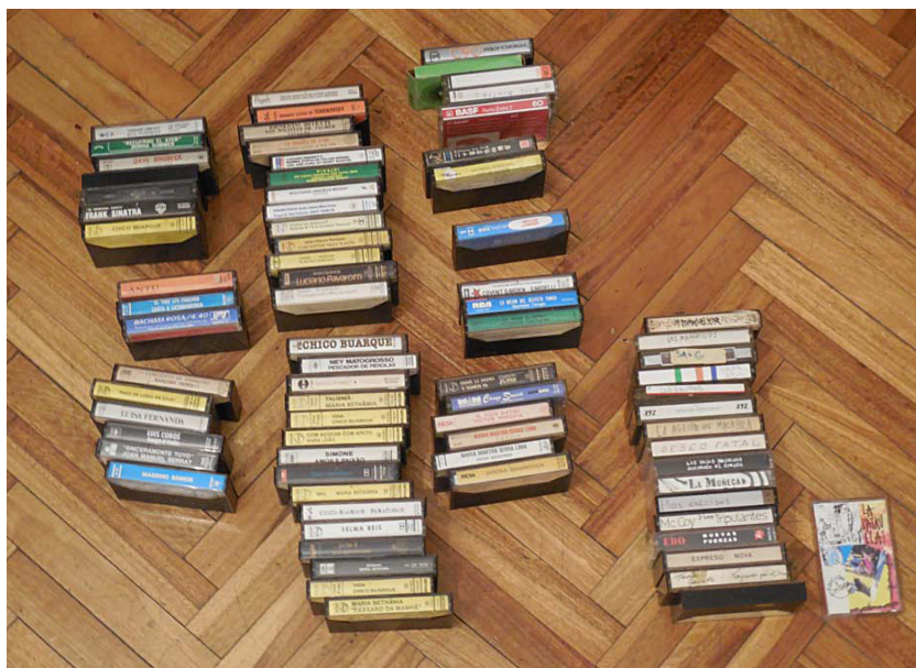
Figura 3. Detalle de los cassettes de Caballito