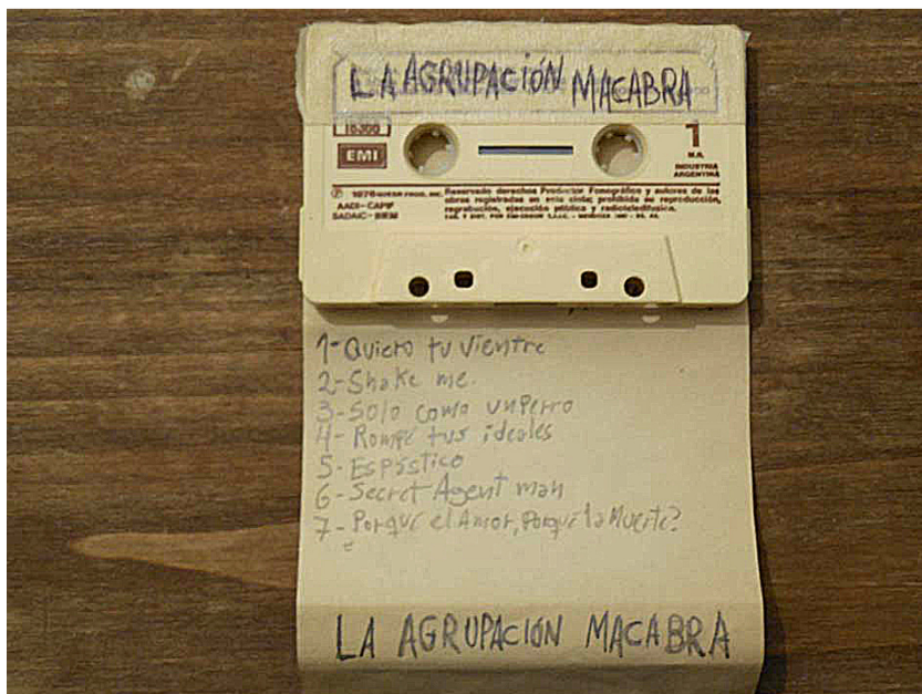
Figura 5. Demo sobregabado en cassette de software