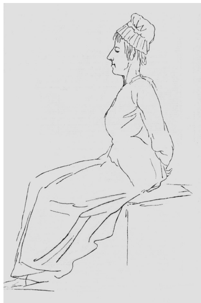
Fig. 3. Jacques-Louis David, “Marie-Antoinette, reina de Francia llevada al suplicio”, 16 de octubre de 1793.

Ciertas reproducciones de ese dibujo circulan en el París de Baudelaire: una entrada en el Journal de los Goncourt del 18 de abril 1859 evoca una “fotografía del dibujo de David”, criticando su “crueldad”. 96 El boceto aparece mencionado ese mismo año en el texto apologético y monarquista de Horace de Viel-Castel, Marie-Antoinette et la Révolution française . 97 Conociera o no Baudelaire el dibujo de David, las correspondencias son perceptibles y dialogan con representaciones tópicas grabadas en el imaginario colectivo. La “toilette” de los condenados a la