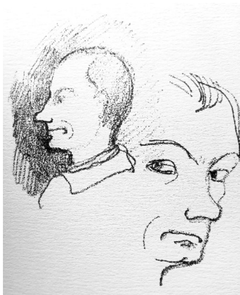
Fig. 2. Autorretrato, c. 1857.

La metáfora del guillotinado “de voz cortante” dialoga sutilmente con el autorretrato de 1857, que a su vez recuerda el dibujo, atribuido a David, de María Antonieta yendo al cadalso (1793).