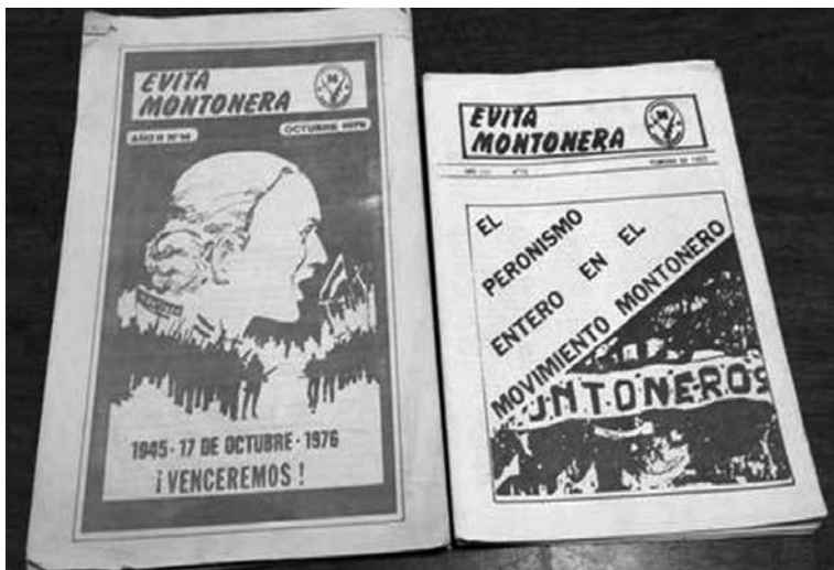
Imagen 8: Evita Montonera N° 14 (octubre de 1976) y N° 15 (febrero de 1977).

De este modo observamos que las condiciones materiales son parte ineludible para comprender la historia de la revista. El análisis de EM no puede agotarse en la lectura de sus “contenidos” sino que debe tener en cuenta las formas de impresión y circulación, a las que nos dedicaremos en los últimos dos capítulos de este libro.