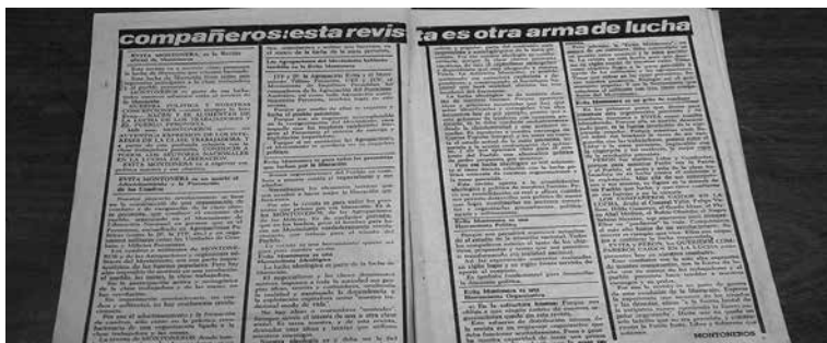
Imagen 7. Evita Montonera Nº 1 (diciembre de 1974).

Desde el momento inicial, los montoneros buscaron legitimarse como auténticos herederos del movimiento peronista e instruyeron a sus lectores con consignas claras: “Nuestro objetivo no es la violencia.