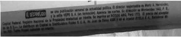
Imagen 4. El Descamisado N° 1 (mayo de 1973). Recuperado por la autora del repositorio CeDInCI.