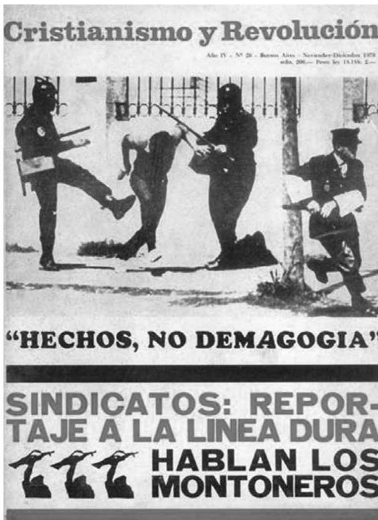
Imagen 1. Cristianismo y Revolución N° 26