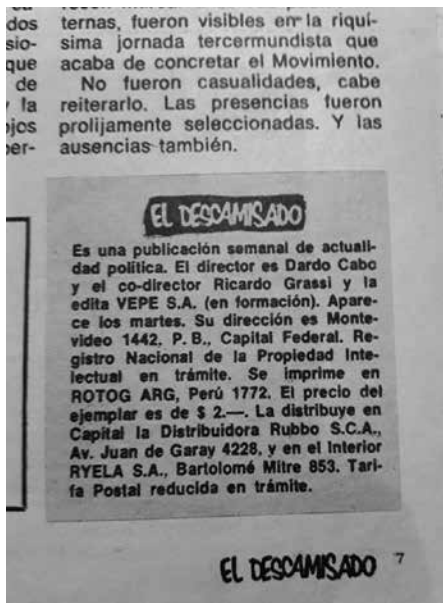
Imagen 5: El Descamisado N° 2 (mayo de 1973).