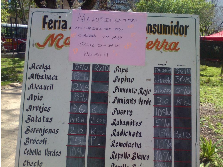
II) Fotografías de la feria en la Facultad de Ciencias Agrarias y Forestales UNLP