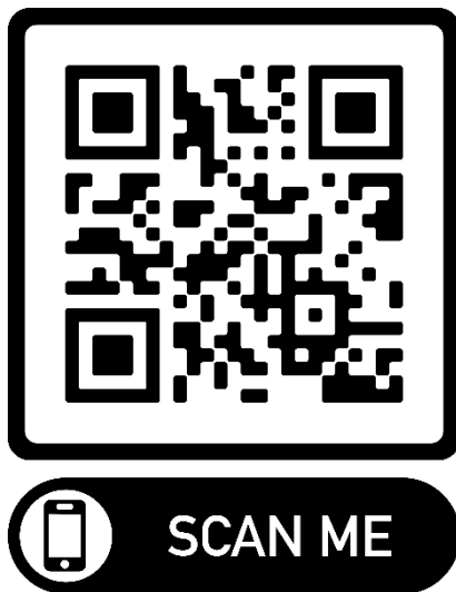
Imagen 3: Código QR de la playlist de las Ficciones Interactivas de Daiana Hernández. Se accede por medio de una app lectora de QR, disponible en app stores, y por medio de la app de YouTube.

Daiana Hernández es una Youtuber argentina que publica videos en la plataforma desde 2012. Su canal de YouTube cuenta con casi 3.000.000 de suscriptores, y está destinado a millennials y, especialmente, a centennials. Los videos alojados en el canal pertenecen, al género de la comedia, principalmente. Desde parodias de programas televisivos y de videoclips, webisodios y sketches, se centra más que nada en contenidos ficcionales, challenges, vlogs y video-reacciones. Llama la atención, además, un tipo de contenido que intenta acercarse más a lo periodístico, contando con un video de 2016 donde pudo entrevistar a la primera dama, Michelle Obama.