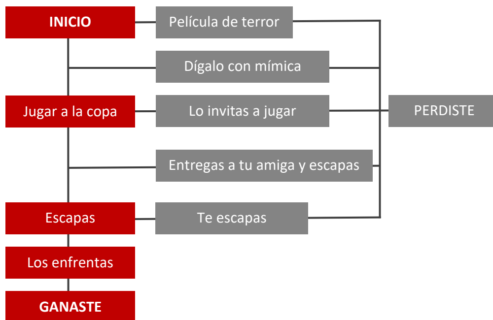
Gráfico 1. Esquema de las opciones que llevan a la victoria (en rojo) y de las cuales llevan a la derrota (en gris) en «¿Te animas a entrar? Especial Halloween» de Daiana Hernández.

entonces, llama a una doble participación, dirigiéndose a un público que no sólo consume videos, sino que busca acercarse a sus ídolos por medio de la interacción directa.