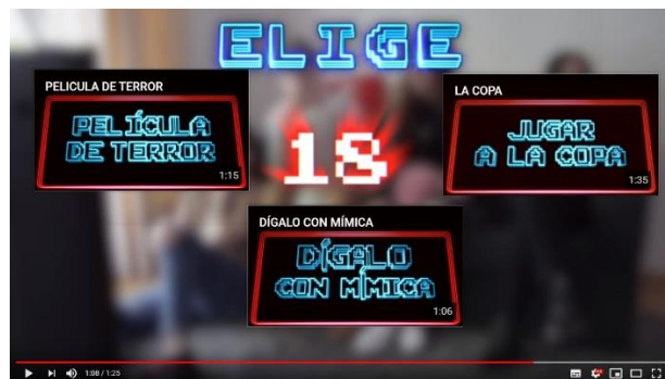
Imagen 5: Modo de seleccionar las opciones para continuar con la historia en el canal de YouTube de Daiana Hernández.

usuarios a ver los otros videos e insta a la participación, además, contando su experiencia en el juego por medio de comentarios. Esto se debe a la autonomía de la acción publicitaria del contenido de HellPizzaNZ, al tratarse de un concurso, puesto que en el canal de la Youtuber se busca adeptos que vean sus videos periódicamente. Daiana,