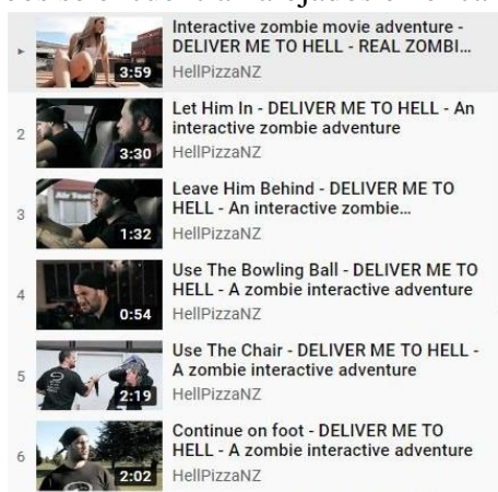
Imagen 2: Algunas de las opciones de «Deliver me to Hell», ordenadas en una tira de videos de YouTube.

principalmente. Por medio de videos innovadores o que hacen uso de canciones o de figuras reconocidas, intentan transformar a aquello que quieren vender en productos de consumo masivo, aprovechando la llegada de las redes sociales o de las plataformas audiovisuales. Normalmente de corta duración y con lenguajes publicitarios, estos videos inundan YouTube, que aloja innumerables videos ya sea como pre-roll 12 o patrocinados. Sin embargo, algunas marcas deciden hacer uso de las posibilidades más interactivas en materia audiovisual que permite la plataforma. Es así como Hell's Pizza Nueva Zelanda lanza en 2010 un