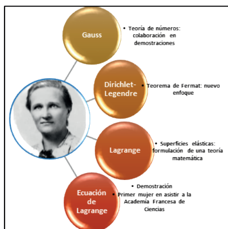
Marie-Sophie Germain (1776-1831)