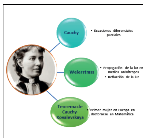
Sofia Vasilyevna Kovalevskaya (1850-1891)