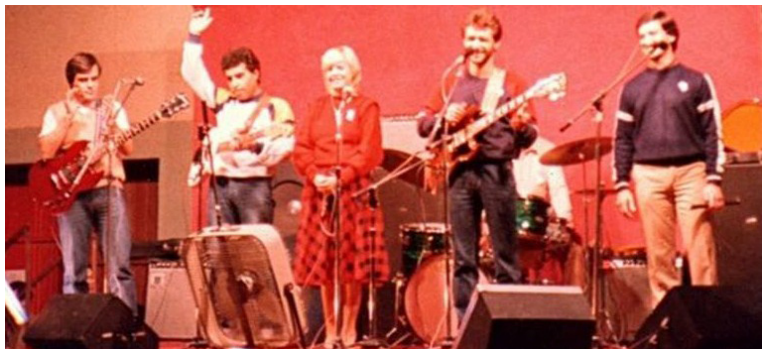
Figura 3. Recital de Pueblo de Dios (ca. 1983)