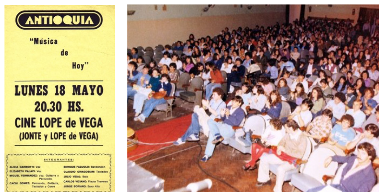
Figura 4. Folleto y público del recital de Antioquía, realizado el 18 de mayo de 1981 en el Cine Lope de Vega, Capital Federal