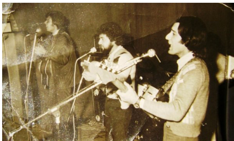
Figura 1. Recital de Profecías (ca. 1969)