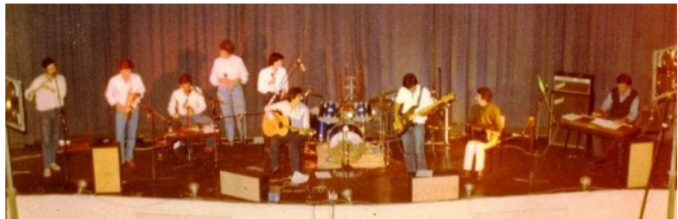
Figura 2. Recital de Antioquía (ca. 1982)