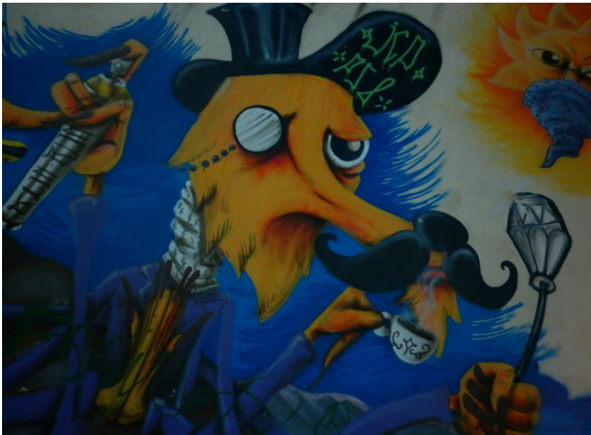
Mural realizado por graffiteros