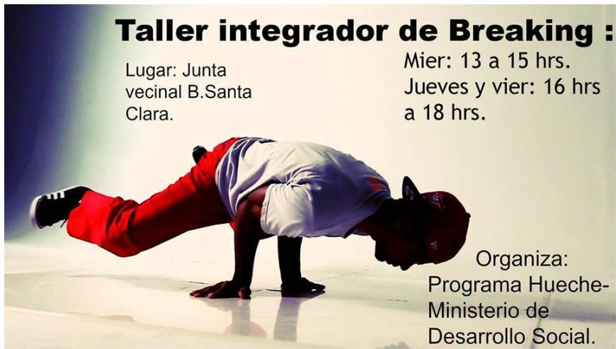
Flyer de curso de breakdance