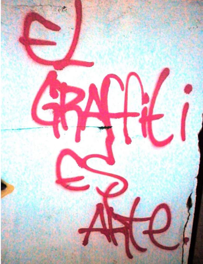
“El graffiti es arte” realización de murales (graffiti legal)