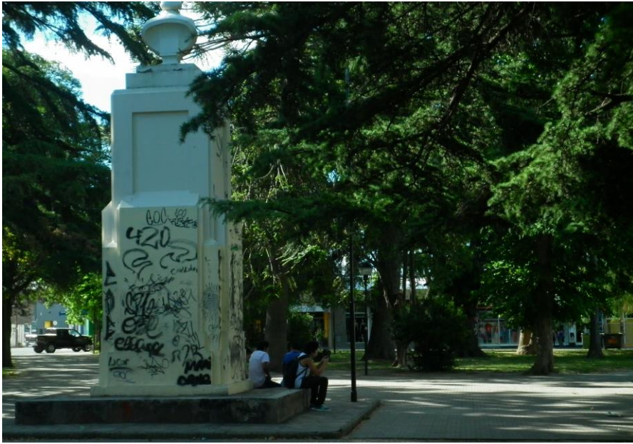
B-boys en la plaza Alsina, en el centro comercial de la ciudad