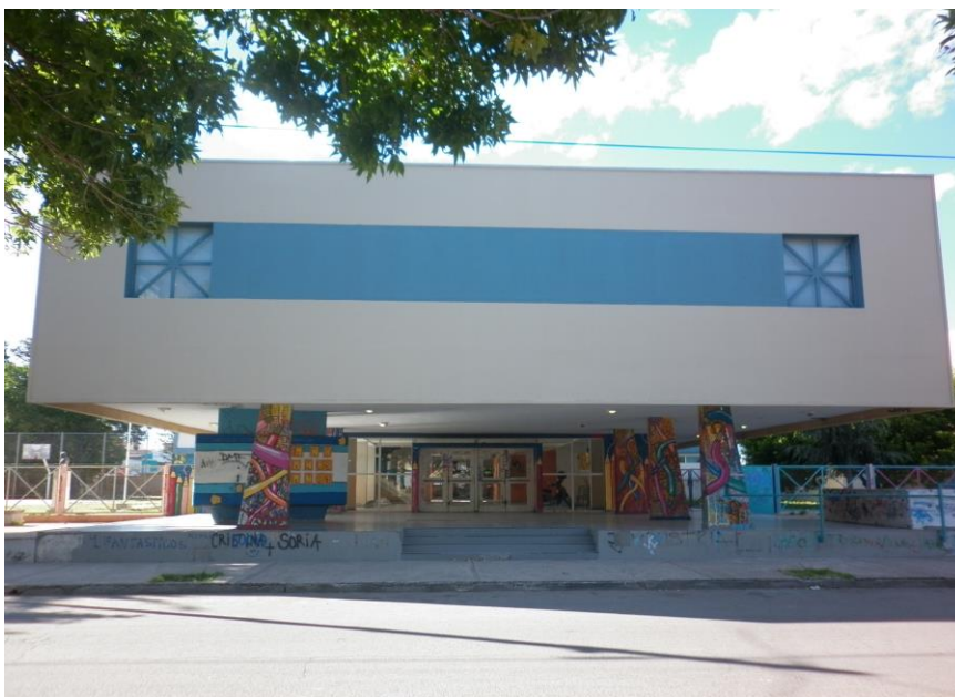
CEM N° 8, hall en donde se practica breakdance