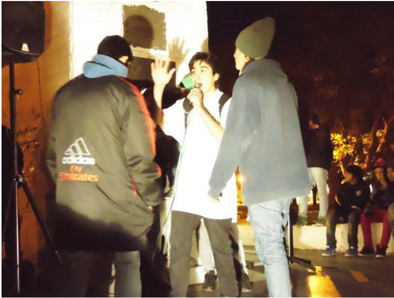
“Batalla” de MCs en Plaza San Martín