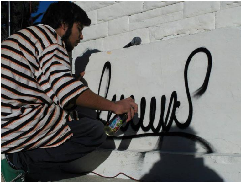
Joven taggando momentos previos a una “batalla”