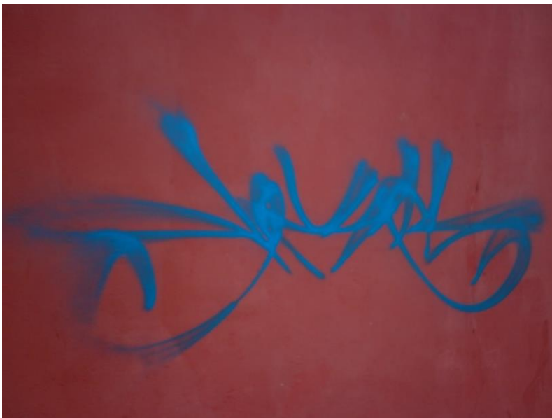
Ejemplo de tagg en Barrio Santa Clara