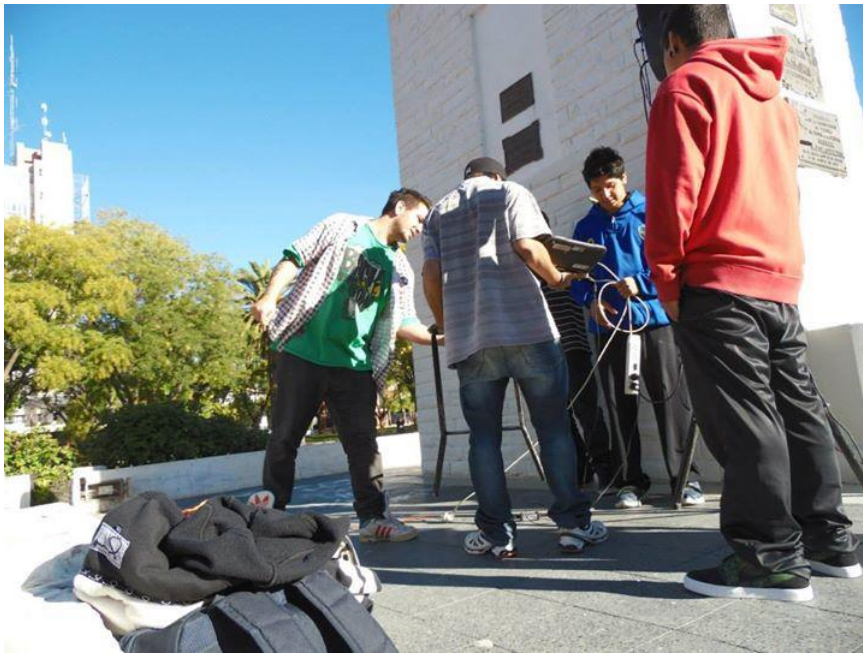
Preparación para una “batalla” en la plaza San Martín