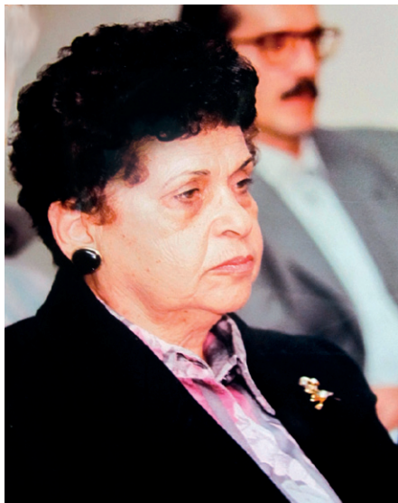
Fotografias da coleção pessoal de Fanny Tabak.

[1] O PLACTS foi um movimento surgido na década de 1960 no bojo de uma movimentação intelectual mais ampla de contestação ao desenvolvimentismo e a dominação cultural vivenciada pelos países latino-americanos na Pós-Guerra. “Em sua essência, o PLACTS contestava a visão do ‘modelo linear de inovação’, segundo o qual toda inovação tecnológica segue um padrão mais ou menos bem definido de descoberta científica-incorporação desse conhecimento ao acervo humano-desenvolvimento de produtos” (frase veiculada no site oficial < http://www.placts.org/ >).