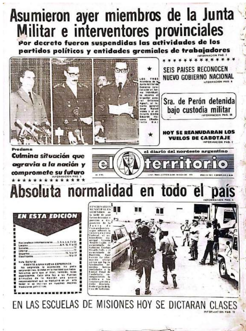
Tapa de El Territorio - Publicado 25 de marzo de 1976.

aunque lamentablemente se produjo una pérdida significativa de documentos durante este proceso.