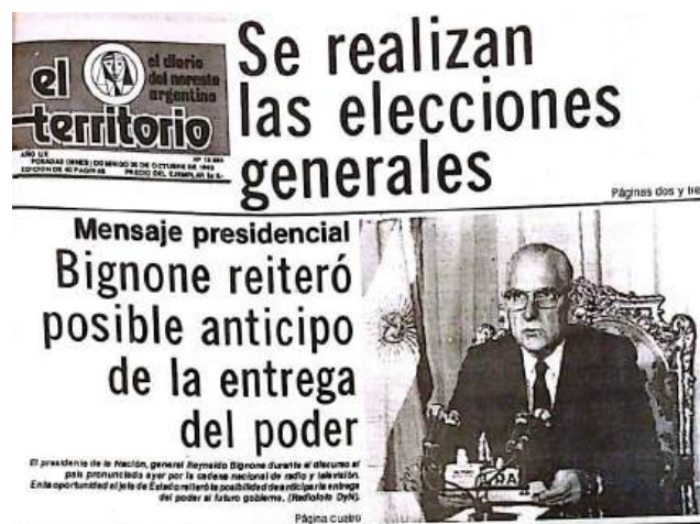
Tapa de El Territorio - Publicado 30 de octubre de 1983

Las elecciones de 1983 se llevaron a cabo el 30 de octubre en todo el país. En Misiones, se debían elegir 7 diputados nacionales, 18 electores, gobernador y vicegobernador, 40 diputados provinciales, 49 intendentes municipales y 26 comisiones de fomento. El padrón electoral comprendía un total de 312.560 votantes, divididos en 161.992 varones y 150.568 mujeres.