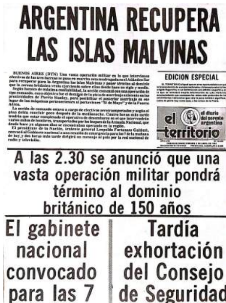
Tapas de El Territorio - Publicado 2 de abril 1982

En relación con el cierre de la dictadura, Leopoldo Fortunato Galtieri asumió la presidencia en 1981, en un escenario marcado por tensiones internas en las Fuerzas Armadas y una recesión económica que amenazaba la estabilidad del país. La ocupación de las Islas Malvinas por fuerzas argentinas en abril de 1982 desencadenó un conflicto bélico con Gran Bretaña, culminando en la rendición argentina en junio de ese mismo año. Durante ese periodo bélico, los medios locales comunicaban y reproducían fielmente la línea oficial propiciada por la agencia de noticias del Estado, Télam.