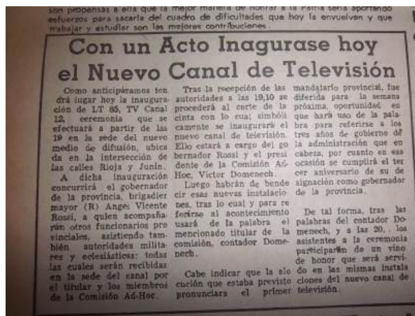
Recorte de El Territorio - Publicado el 18 de noviembre de 1972

Teniendo en cuenta al mismo autor, en 1972, cuando Canal 12 salió al aire con una potencia de transmisión de 2 kilovatios (2 kW), su alcance era limitado. En ese momento, su señal sólo llegaba a la ciudad de Posadas y a las localidades cercanas a la capital de la provincia de Misiones. Esta limitación geográfica marcó un comienzo modesto para la emisora, pero su impacto resultó ser significativo.