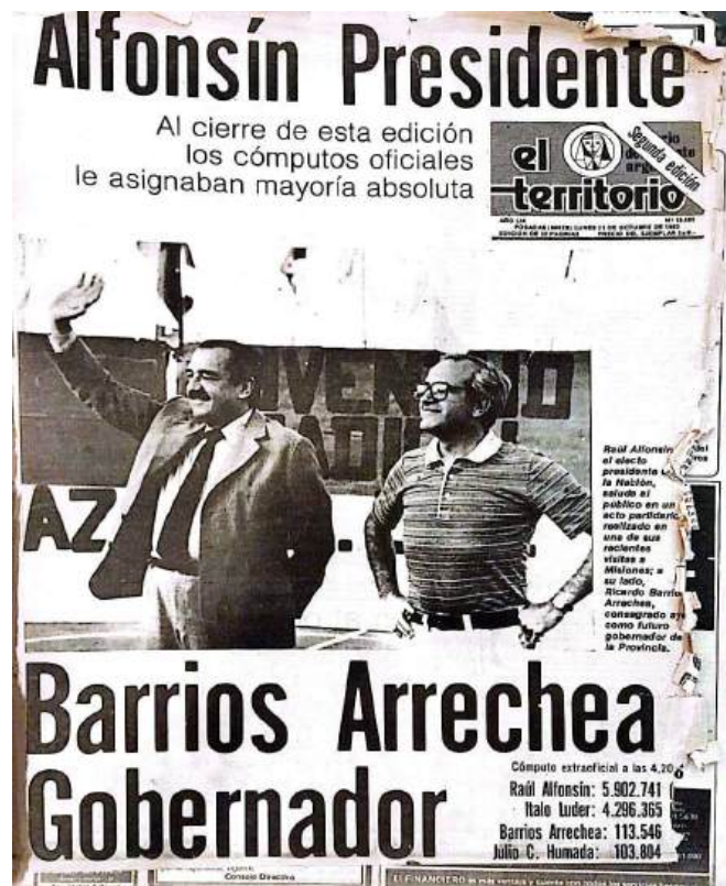
Tapa de El Territorio - Publicado 31 de octubre de 1983

La reunión de los colegios electorales estaba programada para el 30 de noviembre, pero la victoria del radicalismo aceleró el proceso y se llevó a cabo el 28 de noviembre en Misiones. La elección resultó en 9 votos a favor de los candidatos radicales y 8 para el PJ.