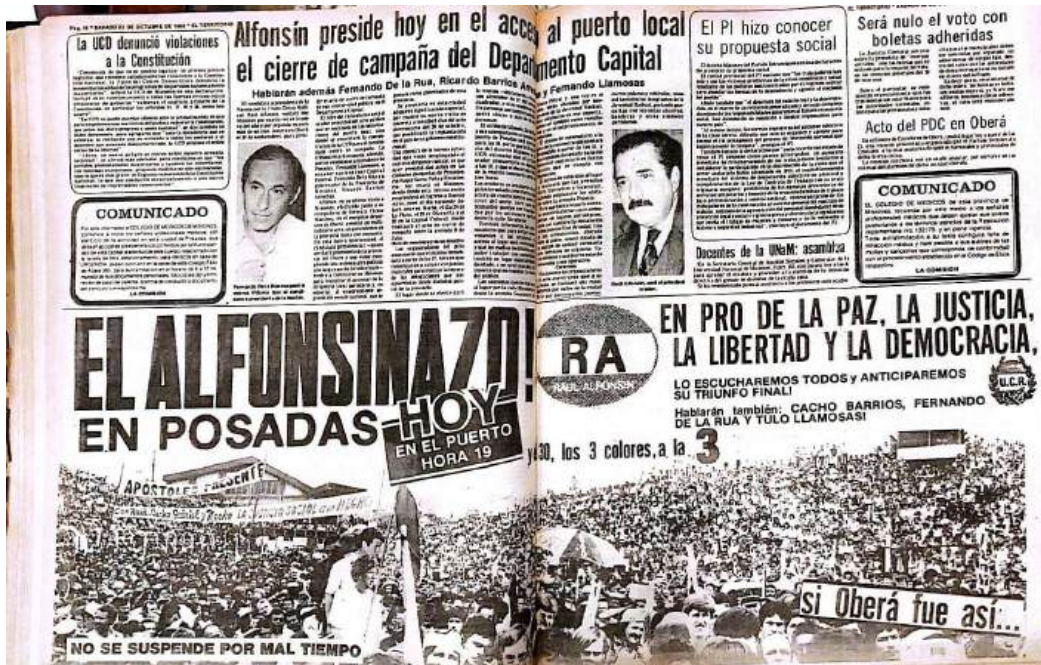
Página de El Territorio - Publicado 22 de octubre de 1983

personas. En medio de una conversación Lobato y su colega discreparon en sus estimaciones de la cantidad de asistentes, optando por consultar a la policía. La cifra proporcionada por la policía fue de 80.000 personas, y decidieron tomar un punto intermedio.