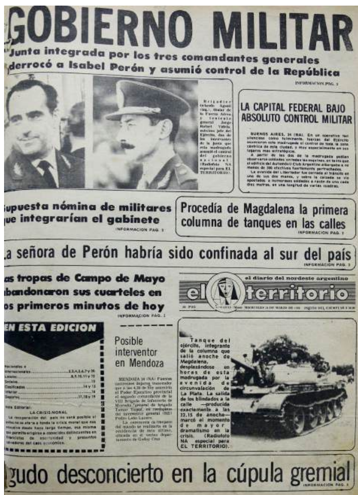
Tapa de El Territorio - Publicado 24 de marzo de 1976.