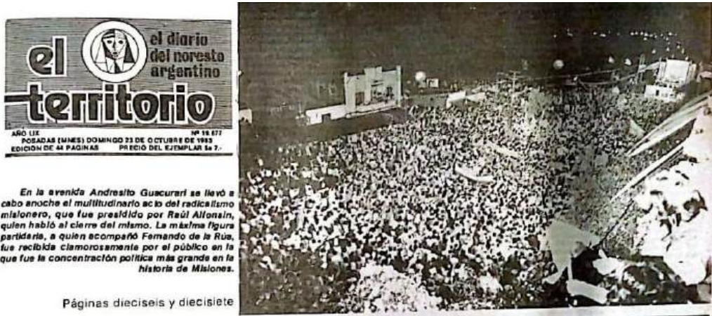
Tapa de El Territorio - Publicado 23 de octubre de 1983