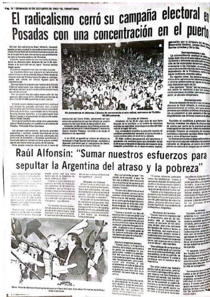
Página de El Territorio - 22 de octubre de 1983