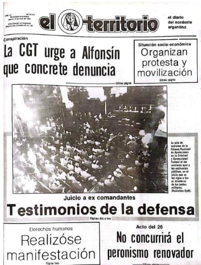
Tapa de El Territorio - Publicado 23 de abril de 1985

“Una vez que se vino la restauración del sistema fue todo muy novedoso y fue un compromiso. Así como la sociedad argentina se comprometió con la democracia decir no queremos aquello, nunca más, queremos esto al precio que sea . La libertad no tiene precio, entonces el periodismo también parecía que tenía que despertar, y así empezar a rechazar las barreras periodísticas y poder hacer las cosas con libertad. Bueno, también como una forma también de acompañar la reacción de la sociedad, del pueblo”.