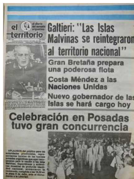
Tapas de El Territorio - 3 de abril de 1982

En relación con el cierre de la dictadura, Leopoldo Fortunato Galtieri asumió la presidencia en 1981, en un escenario marcado por tensiones internas en las Fuerzas Armadas y una recesión económica que amenazaba la estabilidad del país. La ocupación de las Islas Malvinas por fuerzas argentinas en abril de 1982 desencadenó un conflicto bélico con Gran Bretaña, culminando en la rendición argentina en junio de ese mismo año. Durante ese periodo bélico, los medios locales comunicaban y reproducían fielmente la línea oficial propiciada por la agencia de noticias del Estado, Télam.