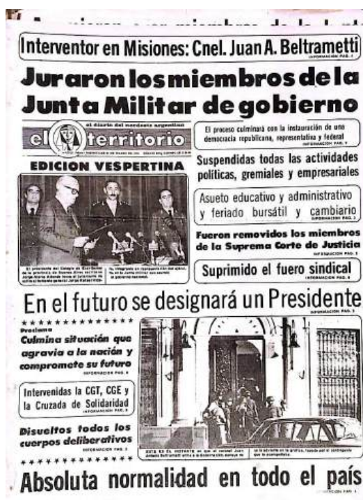
Tapa de El Territorio - Publicado 24 de marzo 1976, versión vespertina

La práctica del periodismo en la provincia de Misiones durante la última dictadura argentina (1976-1983) estuvo marcada por restricciones significativas impuestas por la dictadura cívico-militar.