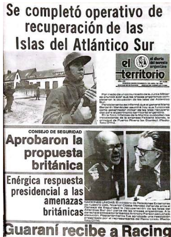
Tapa de El Territorio - Publicado 4 de abril de 1982.