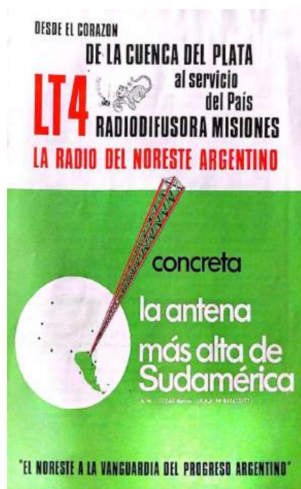
Folleto publicitario de LT4- Publicado junio de 1977

La señal de LT4 tenía un alcance que se extendía hacia la vecina provincia de Corrientes, así como hacia partes de Paraguay y Brasil. Los programas más populares entre la audiencia eran, en primer lugar, los musicales como "Mi tierra roja" y "Argentinísima", mientras que en segundo lugar se encontraban los programas de noticias, que habían reemplazado en la zona rural la tradicional lectura de periódicos de las áreas urbanas. Además, la programación incluía programas con menor audiencia, como "Laboratorio Yasy Yateré" y "La hora del litoral," que se transmitían después del mediodía.