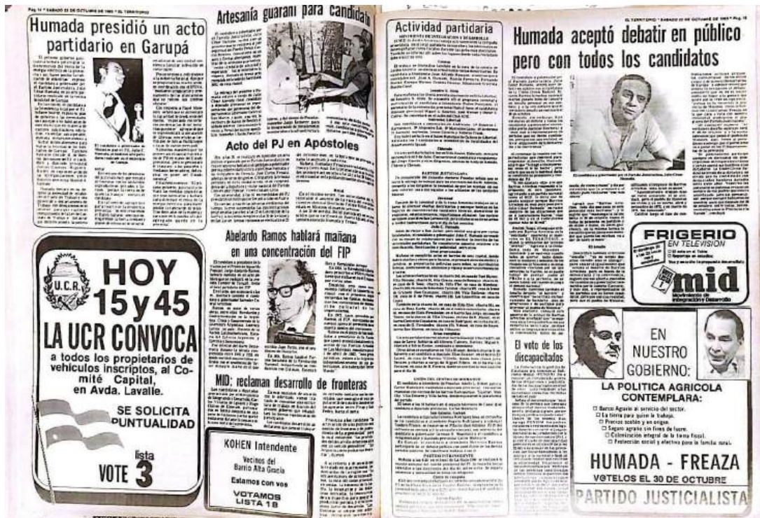
Página de El Territorio - Publicado 22 de octubre de 1983

De esta manera, esta etapa de transición no sólo se tradujo en cambios estructurales, sino que también influyó en la mentalidad de la sociedad misionera. La transición despertó un renovado interés y participación ciudadana, fomentando un espíritu democrático que se reflejó en la sociedad. Algo que se proyectó en la forma en que se percibía y se abordaba la información.