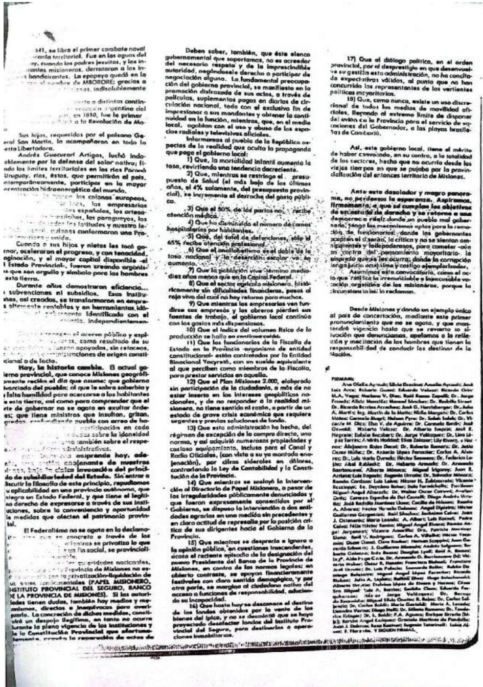
Solicitada de la CODELIM, segunda página- Publicado 13 de noviembre de 1980

más antiguo de Misiones. En este texto, se reclamaba con firmeza el regreso a una democracia real, donde se respetarán los principios de un estado de derecho, se aceptará el disenso y la crítica, y no se permitiera a los gobernantes actuar con omnipotencia y soberbia. También se abogaba por el juicio imparcial y castigo ejemplar para la corrupción.