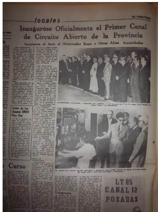
Página de El Territorio - Publicado el 19 de noviembre de 1972

En esa época, la televisión abierta en Posadas se veía con señales que no eran de emisoras argentinas, sino que la población recibía la señal de Canal 13 de Paraguay. Este hecho es relevante en el contexto de la historia del canal, ya que la llegada de la emisora, aunque con un alcance limitado, proporcionó a la comunidad de Posadas y sus alrededores una fuente de información y entretenimiento más cercana y relacionada con su realidad local.