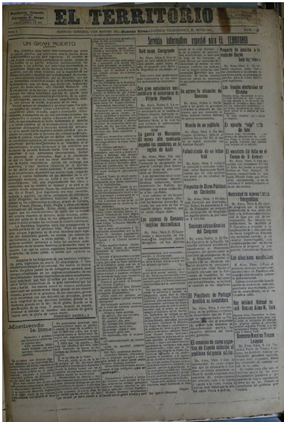
Ejemplar más antiguo en existencia de El Territorio - N.º 116 (mediados de septiembre de 1925)

origen a "El Territorio" el 2 de junio de 1925 en Posadas. Este hecho marcó el inicio de una era de información y comunicación en la región.