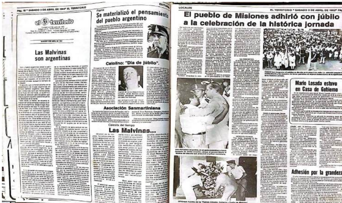
Página de El Territorio - Publicado 3 de abril de 1982

medida que la guerra se prolongaba y las bajas argentinas aumentaban, la opinión pública comenzó a cambiar y los medios de comunicación comenzaron a cuestionar la estrategia militar del gobierno.