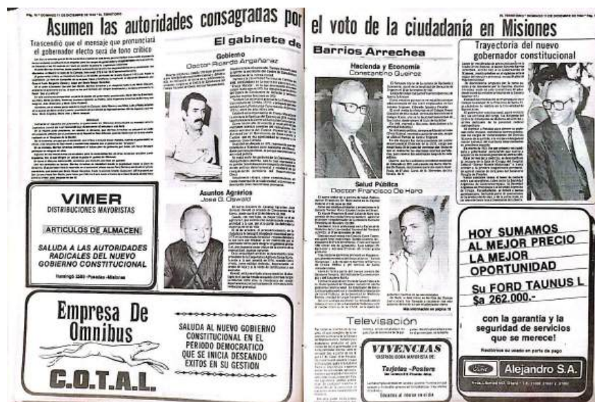
Página de El Territorio - Publicado 11 de diciembre de 1983