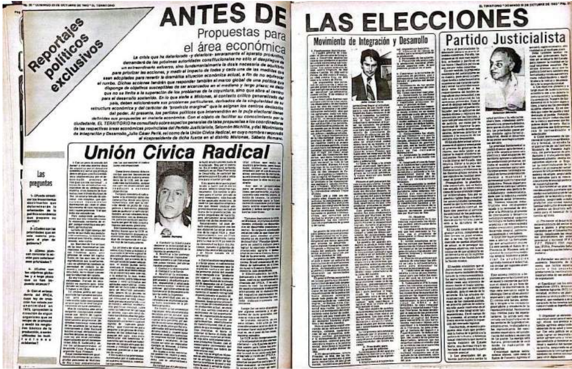
Página de El Territorio - Publicado 23 de octubre de 1983