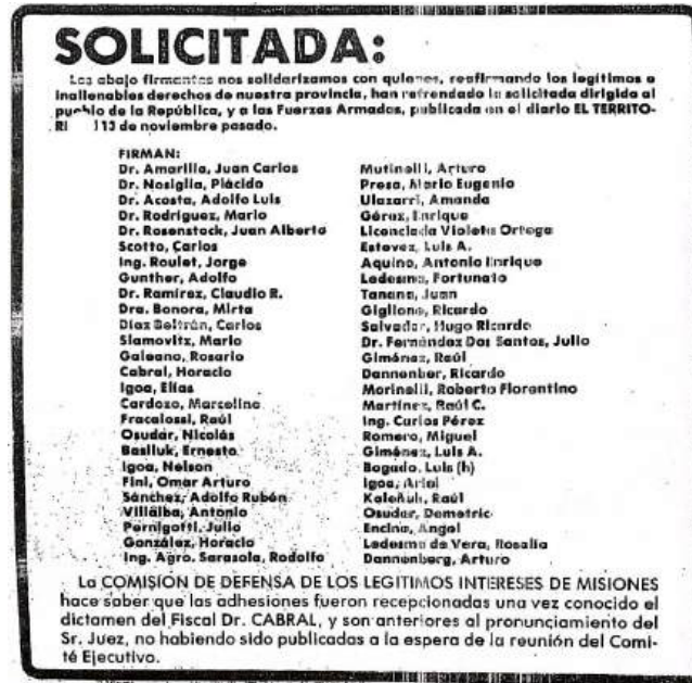
Firmantes de la solicitada de la CODELIM - Publicado 13 de noviembre de 1980

Vale recordar que, luego de la publicación de la solicitada de la CODELIM, que terminó con el desplazamiento de la Armada Argentina en la administración de Misiones, en marzo de 1981 asumen autoridades del Ejército Argentino que gobernarían la provincia hasta el fin de la dictadura.