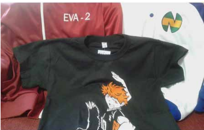
Fig. 6. Ropa no oficial de Evangelion, Hinata de Haikyuu y Captain Tsubasa.