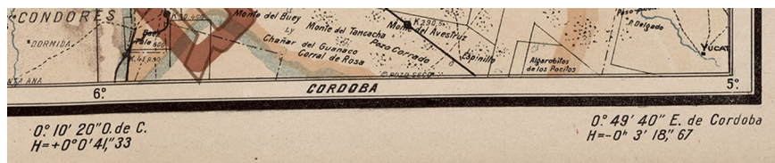
Figura 4. La anotación de la hora referida al punto de partida en Córdoba

Fuentes: Chapeaurouge (1901), hoja 38, e Instituto de Arte Americano.