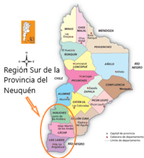
Figura 1: Mapa de la Provincia del Neuquén con división departamental actual