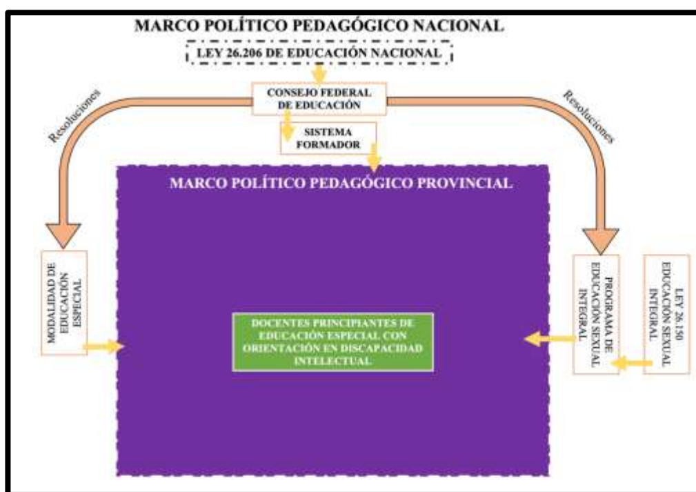
Figura 2 - Marco político pedagógico nacional a partir de la Ley N° 26.206

Hacer énfasis finalmente que estas normativas nacionales y enfoques teóricos del PESI han ido conformando un marco político pedagógico que rápidamente tuvo su correlato en la provincia del Chubut. En este sentido, realizaremos un recorrido similar al propuesto en esta primera parte, para continuar describiendo el contexto en el cual se circunscribe el objeto indagado en la presente tesis. Entonces, el marco político pedagógico nacional queda conformado de la siguiente manera: