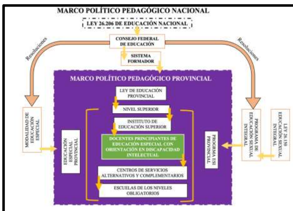
Figura 3 - Marco político pedagógico nacional y provincial

De este modo, el programa analítico de la unidad curricular nos permite caracterizar de manera general, en tanto documento prescripto, el abordaje del taller ESI en el profesorado de educación especial con orientación en discapacidad intelectual, aproximando una trama que logramos reconocer a partir del devenir que venimos haciendo en el presente capítulo, conjugando las perspectivas sobre la formación docente, la educación especial, y la Educación Sexual Integral. Entonces, el marco político pedagógico provincial y el nivel de concreción curricular queda conformado de la siguiente manera: