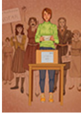
Ilustración de esta página: López Schrock, H. L. (2021). Mujeres en el voto [composición digital]. Programa de Cultura de la Secretaría de Extensión Universitaria de la Universidad Nacional de Quilmes, convocatoria artística “Imaginerías de una lucha”. Bernal: UNQ.

Lopresto, M. (2021). Septiembre llegaba a su fin [cuento corto]. Sociales y Virtuales , 8(8). Recuperado de http://socialesyvirtuales.web.unq.edu.ar/obras-literarias/septiembre-llegaba-a-su-fin/