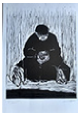
Ilustración de esta página: Vaccarezza, C. (2021). Vivir en el escalón [linografía]. Programa de Cultura de la Secretaría de Extensión Universitaria de la Universidad Nacional de Quilmes, convocatoria artística “Imaginerías de una lucha”. Bernal: UNQ.

Vilardo, C. (2021). Las sociedades a través del tiempo según los medios. El legado de Marshall McLuhan: de la civilización preimpresión a la percepción multisensorial. Sociales y Virtuales , 8(8). Recuperado de http://socialesyvirtuales.web.unq.edu.ar/articulos/las-sociedades-a-traves-del-tiempo-segun-los-medios/