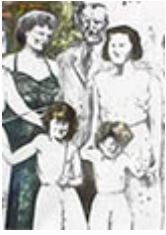
Ilustración de esta página: Coirini, A. (2020). Paseo por el parque [2016]. [Litografía, stencil y tinta]. En Sociales y Virtuales y Programa de Cultura (Coords.), exposición artística #YoMeQuedoEnCasa. Bernal: Universidad Nacional de Quilmes.

Clic en la imagen para visualizar la obra completa