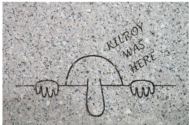
Figura 3. Kilroy was here. Recuperada de https://americacomesalive.com/2014/11/10/kilroy-story-world-war-ii/