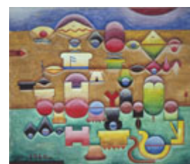
Ilustración de esta página: Xul Solar, Alejandro (1960). Texto Cívico . © Copyright Fundación Pan Klub – Museo Xul Solar – http://www.xulsolar.org.ar/

Las producciones recogen estudios críticos que nos aportan herramientas para pensar e indagar en estas obras, tornan audibles zonas de exploración y ponen en juego una perspectiva propia. Componen un conjunto de reflexiones que nos invitan al placer de la lectura y la posibilidad de pensar nuevas zonas, fronteras y pasajes para las palabras legadas que nos llegan desde aquel tiempo romántico.