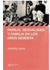
Ilustración de esta página extraída de: Cosse, I. (2010). Pareja, sexualidad y familia en los años sesenta. Una revolución discreta en Buenos Aires , Siglo XXI Editores, Buenos Aires.