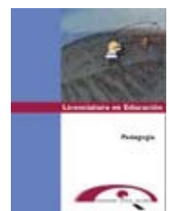
Ilustración de esta página extraída de: Tapa de la primera edición de la carpeta de trabajo Narodowski, M (1999). Pedagogía . Universidad Virtual de Quilmes.

Najmanovich, R. (2014). La educación, el Talmud y su pedagogía. Sociales y Virtuales , 1 (1). Recuperado de < http://socialesyvirtuales.web.unq.edu.ar/articulos-de-los-estudiantes/la-educacion-el-talmud/ >