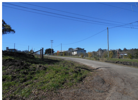
Figura 5. Sierra de los Padres-La Peregrina, zona barrio Sierra de los Padres

calles, en especial las de tierra, se vuelve un desafío. Es entonces cuando la distancia garante de naturaleza puede acobardar, cansar y recluir.