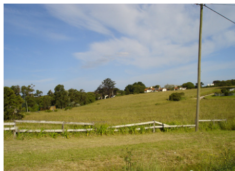
Figura 6. Lomadas en Chapadmalal, barrio Playa Chapadmalal