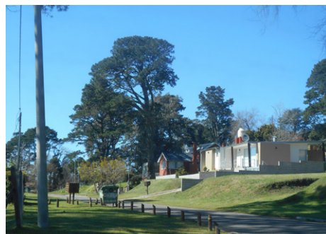
Figura 4. Sierra de los Padres-La Peregrina, zona Colinas de los Padres

En Sierra de los Padres-La Peregrina, los entrevistados valoran la observación de estrellas, del inicio y fin de los días, de fauna de la zona y fenómenos meteorológicos como esporádicas y pequeñas nevadas. Llama la atención que estas, por su escasa frecuencia sean, sin embargo, un punto destacado en varios discursos. De este modo, lo inusual (las nevadas, el avistamiento de algún ciervo) se naturaliza y convierte en protagonista de los relatos sobre la vida en la naturaleza. Dentro de esta concepción, también se aprecian la amplitud de los espacios y el silencio (figuras 4 y 5). A la baja densidad de pobladores y viviendas se agregan la presencia de lotes baldíos o vacantes, los relictos de actividades rurales y el vacío de memoria. Acerca de este último punto, en la historia de la localidad se superponen las biografías de sus habitantes, quienes la van reconstruyendo lejos de testigos conocidos y de los controles sociales “de toda la vida”.