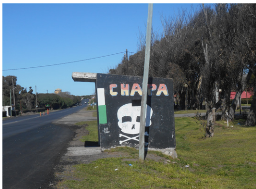
Figura 3. Expresiones de arraigo, Chapadmalal

o agroecológica. Asimismo, algunos expresan descreimiento de las instituciones del Estado y con ello la necesidad de generar alternativas autogestionadas para lograr cambios positivos en la localidad. Desde un punto de vista territorial, esta comunidad no se circunscribe a un barrio, sino que abarca todo Chapadmalal. Se trata, desde el punto de vista de los sujetos, de una comunidad en el sentido de horizontes compartidos, con disidencias y tensiones, por supuesto, pero objetivos medianamente claros con miras al futuro.