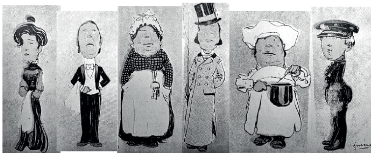
Imagen 12. Figuras ocupacionales del servicio doméstico. Caricatura de la revista Caras y Caretas , Buenos Aires, 6 de julio de 1901, N° 144, p. 37. Tomada de Cecilia Allemandi (2017). Sirvientes, criados y nodrizas. Una historia del servicio doméstico en la ciudad de Buenos Aires (fines del siglo XIX y principios del XX) Buenos Aires: Teseo, p. 75.

Una de las ideas que buscamos sostener en este libro era que el trabajo en hotelería tenía muchas reminiscencias del realizado por el servicio doméstico de casas particulares de principios de siglo. Si respecto de las mujeres realizábamos esta observación principalmente para el caso de las mucamas, en el caso de los hombres se daba principalmente en los puestos del comedor. Ello era claramente visible en sus uniformes y en las formas de arreglar su cuerpo.