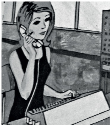
Imagen 6. Dibujo de una telefonista. Hotelería y Turismo. Cuaderno de Orientación Profesional. Editorial Santillana, Buenos Aires, 1970.

identificar a un trabajador. En mayo de 1967, motivado por su despido, un empleado inició un juicio a la empresa hotelera en la que trabajaba desde diciembre de 1965. Para dirimir su categoría, en el marco del juicio, además de hacer referencia a las tareas que concretamente realizaba, se analizó de qué manera iba vestido. Mientras que el demandante sostenía ser conserje, los jueces determinaron su calidad de empleado administrativo tanto por las tareas que efectuaba (confección del libro de sueldos y jornales, el libro de caja, facturación y cobro de servicios), como por su uniforme: saco negro, camisa blanca, chaleco gris, corbata gris y pantalón de fantasía. Este traje, sostuvieron, era propio de un empleado administrativo. En el hotel en que se desempeñaba el trabajador, los uniformes de portero, ascensorista, conserje, etcétera, eran con galones y gorra, y con el nombre del hotel bordado. En cambio, el traje del empleado administrativo no tenía vivos ni leyenda 189 .