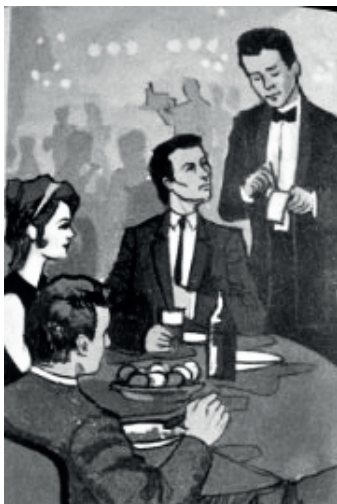
Imagen 14. Dibujo de un maître. Hotelería y Turismo. Cuaderno de Orientación Profesional (1970). Buenos Aires: Santillana