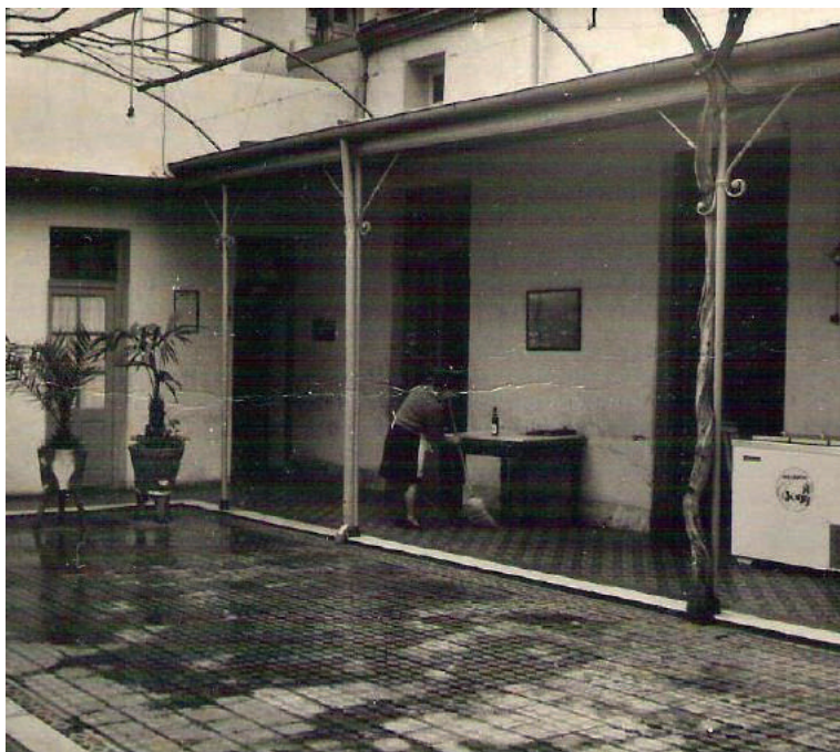
Imagen 7. Carmen en el patio del Hotel Sorrento, Hipólito Yrigoyen 1549, Mar del Plata, c. 1960.