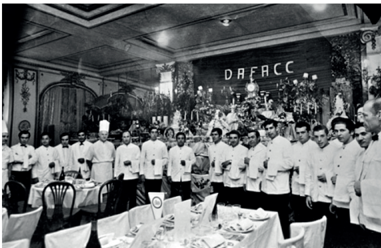
Imagen 15. Mozos del hotel Château Frontenac. (1973). Mar del Plata.