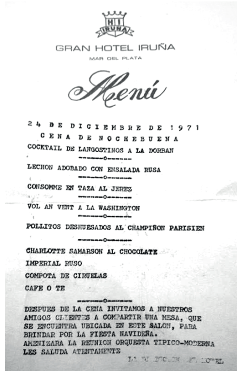
Imagen 9. Menú del Gran Hotel Iruña. 1971.