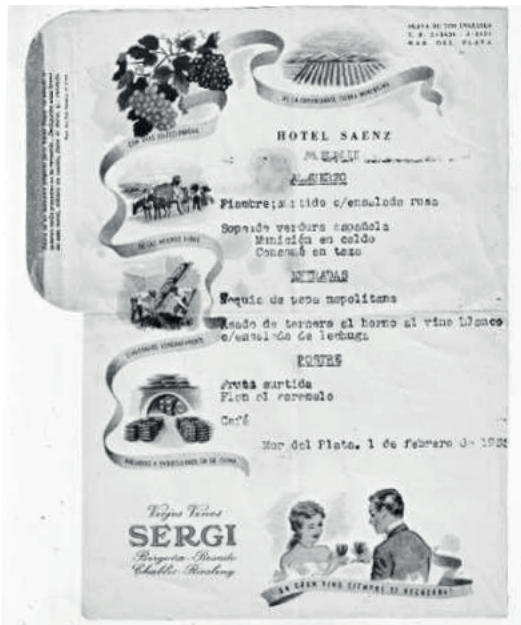
Imagen 10. Menú del hotel Sáenz. 1955.

al almuerzo del día 1 de febrero de 1955 del hotel Sáenz, la denominación de los platos da cuenta de una cocina más sencilla y cotidiana: fiambre surtido con ensalada rusa, sopa de verdura española, muni-ción en caldo, ñoquis de papa napolitana, asado de ternera al horno al vino blanco con ensalada de lechuga, frutas surtidas, flan y café.