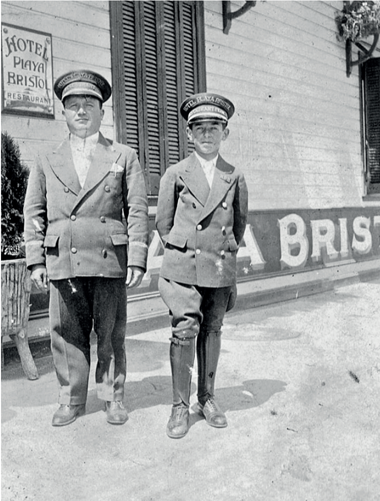
Imagen 3. Cadetes del Hotel Bristol. 1933.