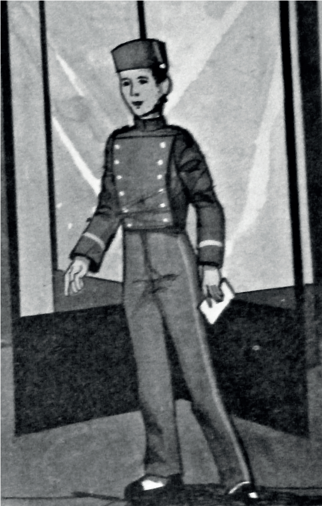
Imagen 5. Dibujo de un botones. Hotelería y Turismo. Cuaderno de Orientación Profesional. Editorial Santillana, Buenos Aires, 1970.