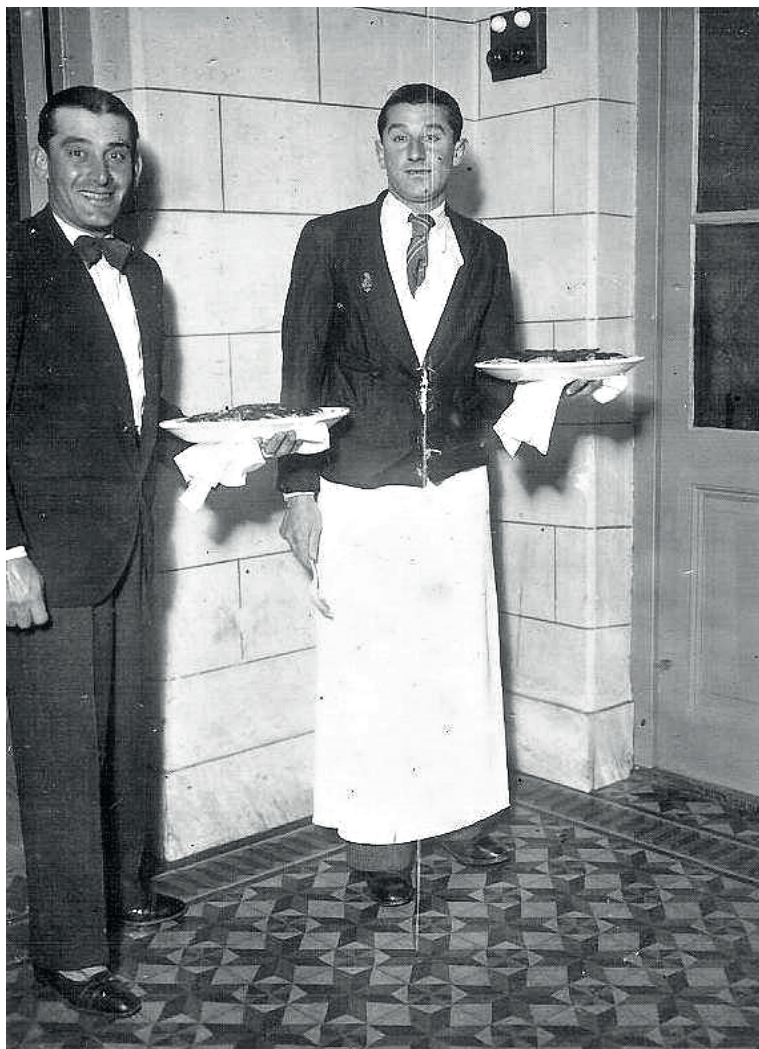
Imagen 13. Mozos del Hotel Sorrento, Hipólito Yrigoyen 1549 (c. 1960), Mar del Plata