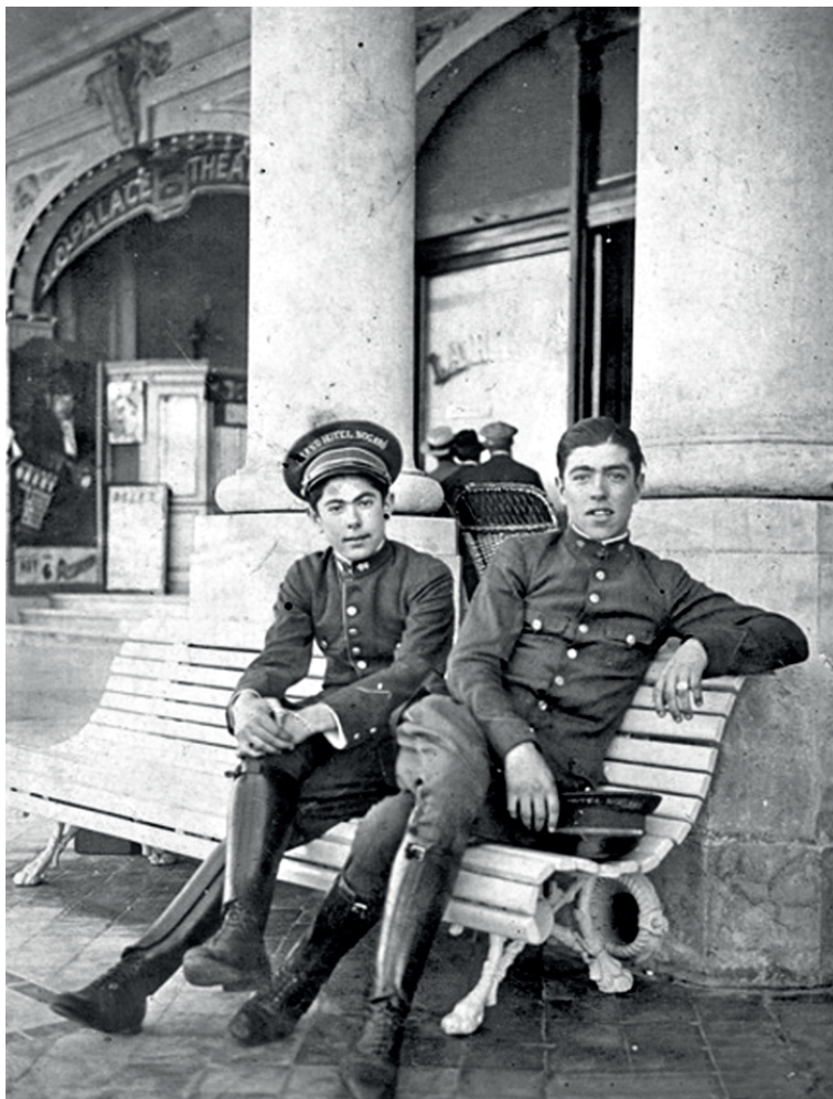
Imagen 4. Cadetes del Hotel Nogaró. C. 1930.