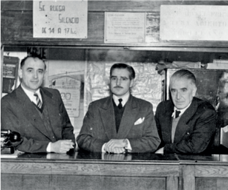
Imagen 2. Conserjería del Hotel Mendoza, Belgrano 2451, Mar del Plata. Sin fecha.

ya que eran actitudes que causarían mala impresión 185 . Como puede observarse, el manual se refería únicamente a trabajadores masculinos, asumiendo que solo los hombres ocupaban esos puestos.