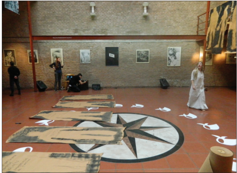
Jornada “El cuerpo a la memoria”.