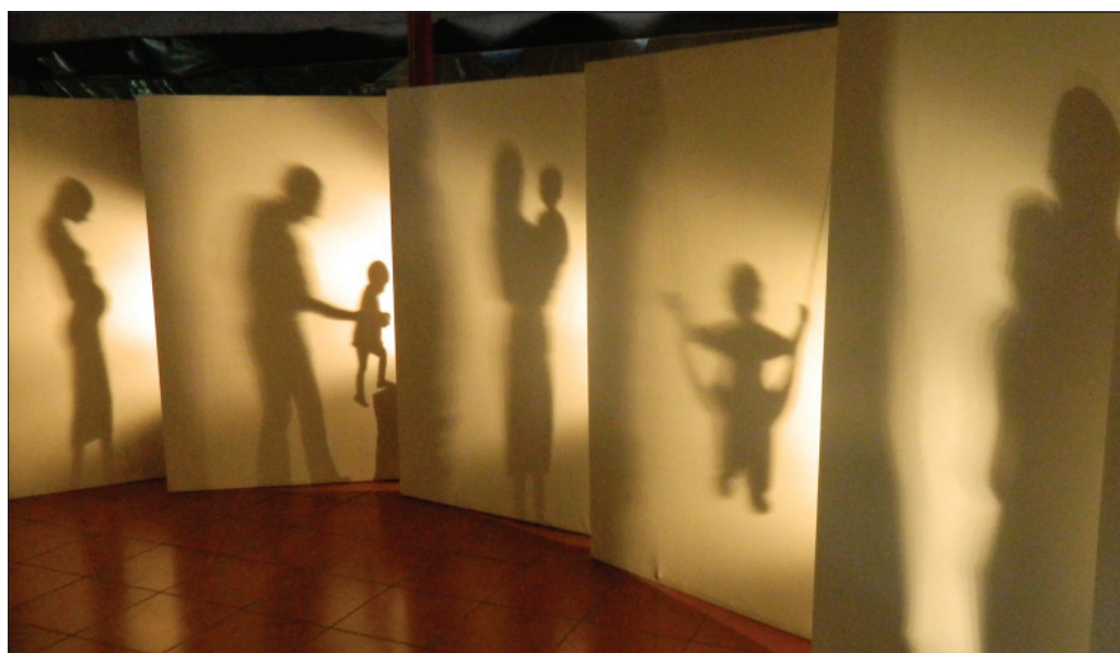
Siluetas en el ágora.