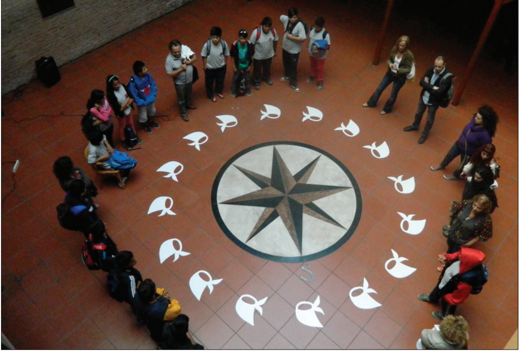
Ronda con la Escuela de Enseñanza Técnica de la UNQ, con la compañía de Julio Flores, impulsor del proyecto “El Siluetazo”.