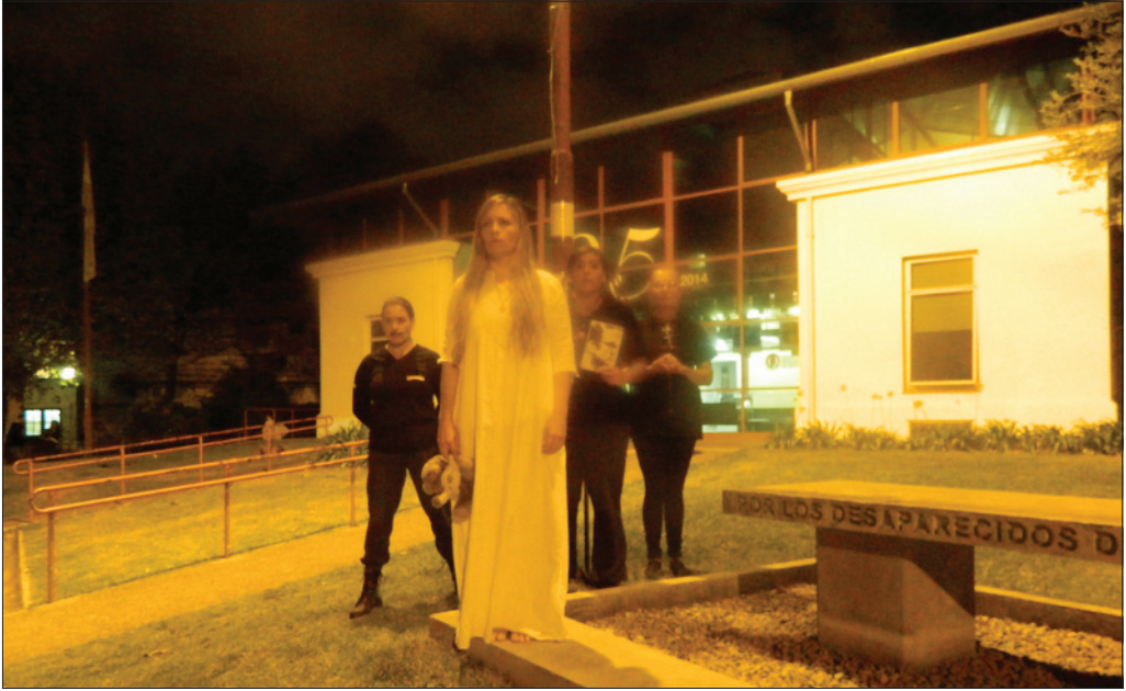
Intervención de Teatro por la Identidad.