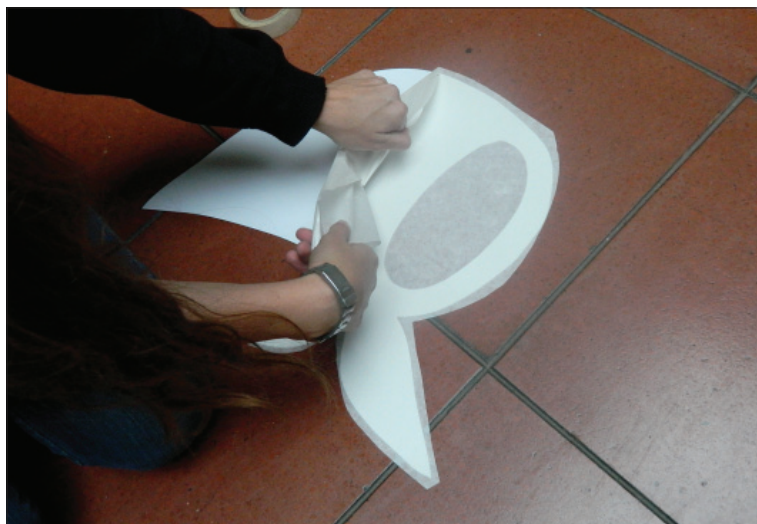
Colocación de la instalación "Círculo de Pañuelos".