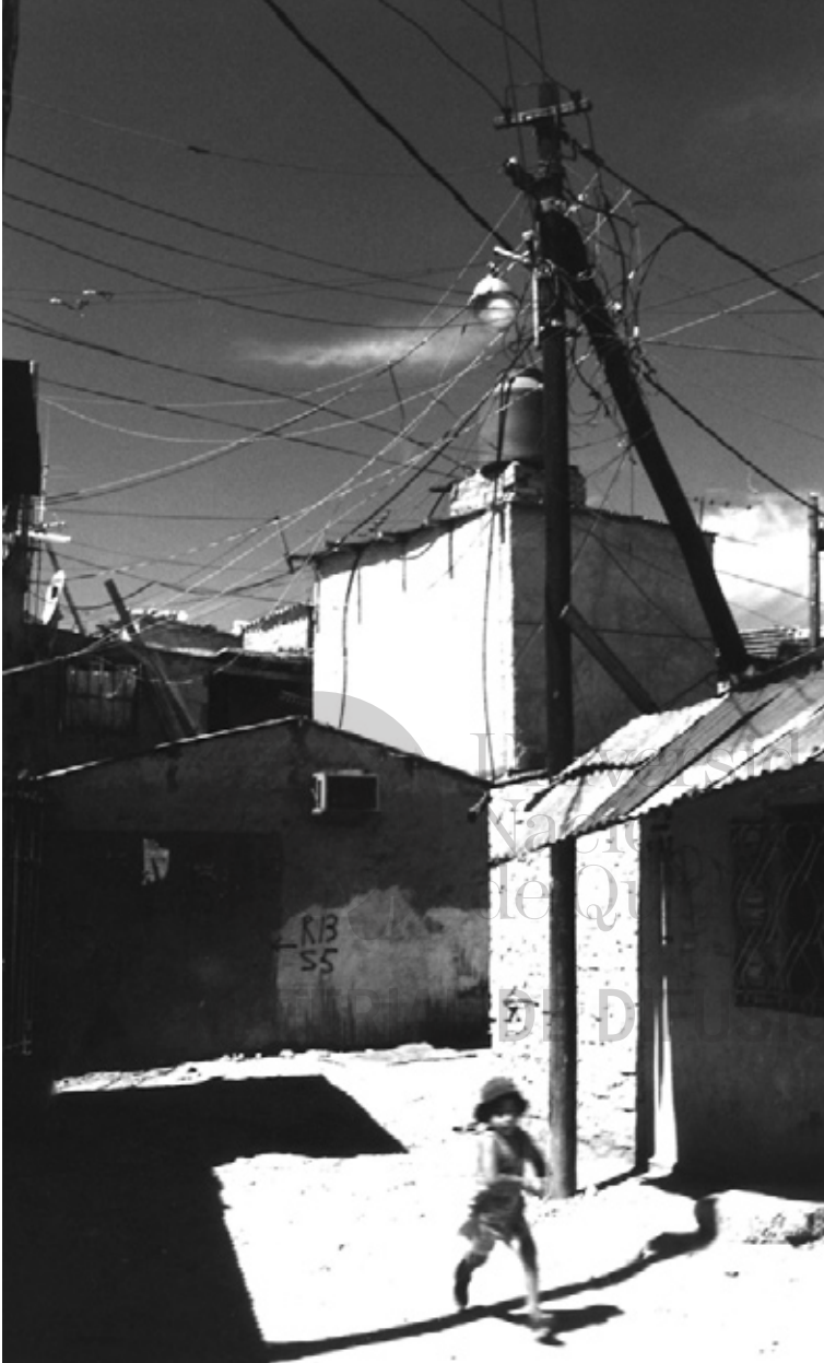
Chico en Barrio Güemes, 2002.