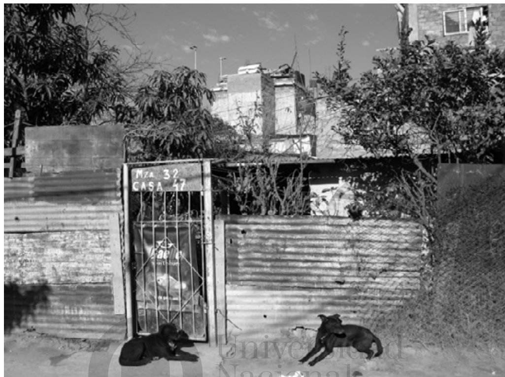
Vivienda del Barrio Autopista, 2009.