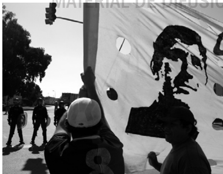
Protesta en Barrio Comunicaciones, 2009.