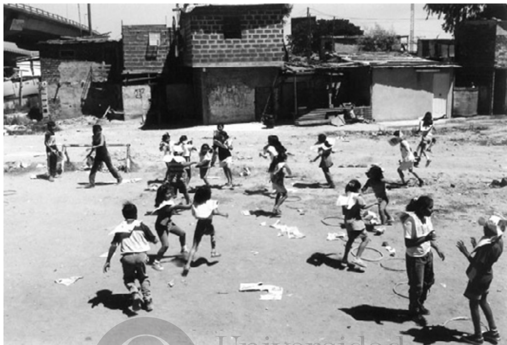
"Mancha pintura", plaza en el Barrio YPF, 2001.