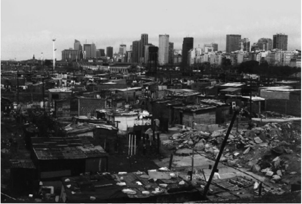
Vista parcial de la Villa 31, 2000.