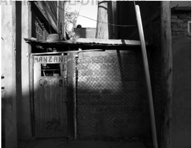
Vivienda del Barrio Güemes, 2009.