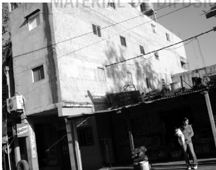
Parada de colectivo en el Barrio Güemes, 2007.