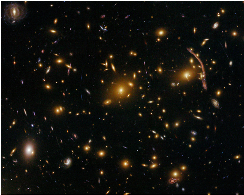
Figura 3. Imagen de lentes gravitacionales tomadas por el Telescopio Espacial Hubble