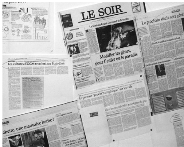
FIGURA 2. RECORTES DE PRENSA SOBRE LAS PAREDES DEL ENTREPISO