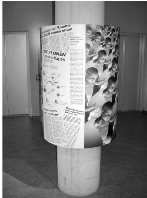
FIGURA 3. UN “DESORDEN DE IMÁGENES” MEDIÁTICAS ALREDEDOR DE UNA COLUMNA, EN NEMO