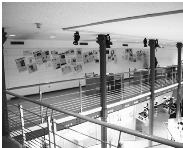
FIGURA 1. EL ENTREPISO EN LA EXPOSICIÓN FOCUS ON GENES

En Focus on genes (Museo de Bruselas), los medios están presentes en el espacio de la exposición, pero en un entrepiso inclinado a través del cual se desciende a la exposición propiamente dicha. Numerosos periódicos tapizan la pared de entrada, con algunos pasajes remarcados. Los visitantes pueden sentarse ante mesas donde hay revistas, obras y prospectos. Pueden leer los periódicos en un espacio que no es el de la visita, sino el de una práctica de consulta y estudio de documentos.