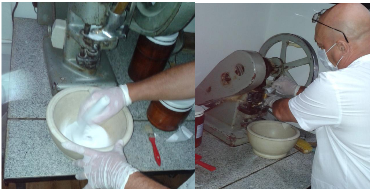
Imagen correspondiente al proceso de elaboración de preparados magistrales alopáticos. Allí se ve al director de la farmacia mezclando los elementos que indicaba la receta para proceder posteriormente a la elaboración mecanizada del comprimido.

El otro laboratorio que posee esta farmacia es el que se utiliza para la elaboración de preparados magistrales herbarios (los que se vinculan a la medicina tradicional). Estos preparados, al igual que los homeopáticos, se desarrollan a partir de las tinturas madres que elabora la propia farmacia.