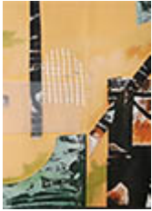
Ilustración de esta página: Falco, S. (2020). En casa 1. [Collage/técnica mixta]. En Sociales y Virtuales y Programa de Cultura (Coords.), exposición artística #YoMeQuedoEnCasa. Bernal: Universidad Nacional de Quilmes.

Ripa, L. (2020). Visto desde después. Sociales y Virtuales , 7(7). Recuperado de http://socialesyvirtuales.web.unq.edu.ar/visto-desde-despues