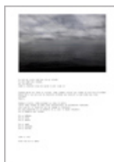
Ilustración de esta página: Gervasi, A. (2019). Como el río (fragmento). [Fotografía y texto]. En Programa de Cultura (Coord.) “Exposición 30 años, 30 obras”. Bernal: Universidad Nacional de Quilmes. Clic en la imagen para visualizar la obra completa

Rabita, M. E. (2019). Viven de lo que dicen y no de lo que callan: reseña del libro Editar sin patrón. La experiencia política-profesional de las revistas culturales independientes. Sociales y Virtuales , 6(6). Recuperado de http://socialesyvirtuales.web.unq.edu.ar/articulos/viven-de-lo-que-dicen-y-no-de-lo-que-callan-resena-del-libro-editar-sin-patron-la-experiencia-politica-profesional-de-las-revistas-culturales-independientes/