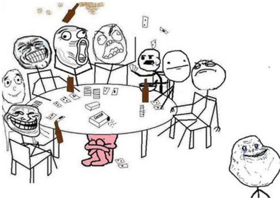
Figura 1. Rage comics , memes que individualmente son usados por los internautas.

Dieciocho años después del Dancing Baby —uno de los primeros memes cibernéticos en formato gif—, la comunidad de Internet 4chan [1] comenzó a producir conscientemente una serie de viñetas que desataron la creatividad de los participantes del foro. Su simpleza, que rememora a los garabatos infantiles, permite a su vez una fácil decodificación de su significado a modo de reproducción y reformulación.