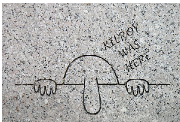
Figura 3. Kilroy was here.