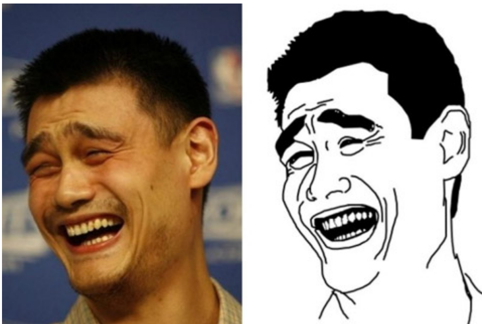
Figura 2. Yao Ming. Creado en Reddit.

En los casos en los que los rage comics presentan facciones más humanas, se puede intuir que existe una fuente real —normalmente, una celebridad—. De cualquier forma, lo que sí permanece son atisbos de los rasgos de la fotografía original de algunas de estas imágenes, aunque el meme funciona como una entidad ajena a aquella. La vectorización de la fotografía dificulta la vinculación con la celebridad o personaje. Más que una supresión de la fuente original, se asiste a un ascenso de la imagen simplificada por sobre la original, cuyo sentido radica en su posterior uso en una situación cómica o satírica —normalmente en una viñeta—.