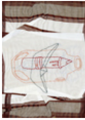
Ilustración de esta página: Ciampini, G. (2019). Hábitat (fragmento). [Dibujos bordados sobre pañuelo]. En Programa de Cultura (Coord.) “Exposición 30 años, 30 obras”. Bernal: Universidad Nacional de Quilmes. Clic en la imagen para visualizar la obra completa