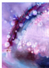
Ilustración de esta página: Valdivia, A. (2019). Un portal (fragmento) . [Técnica mixta sobre tela]. En Programa de Cultura (Coord.) “Exposición 30 años, 30 obras”. Bernal: Universidad Nacional de Quilmes. Clic en la imagen para visualizar la obra completa

Dichano, M. E. (2019). Recalculando: algunas reflexiones sobre las nuevas pantallas. Sociales y Virtuales , 6(6). Recuperado de http://socialesyvirtuales.web.unq.edu.ar/articulos/recalculando-algunas-reflexiones-sobre-las-nuevas-pantallas/