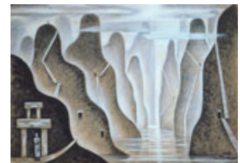
Ilustración de esta página: Xul Solar, Alejandro (1943). Fiordo . © Copyright Fundación Pan Klub – Museo Xul Solar – http://www.xulsolar.org.ar/

Hetze, P. (2016). La formación educativa como posibilidad de emancipación. Sociales y Virtuales , 3(3). Recuperado de http://socialesyvirtuales.web.unq.edu.ar/articulos/la-formacion-educativa-como-posibilidad-de-emancipacion/