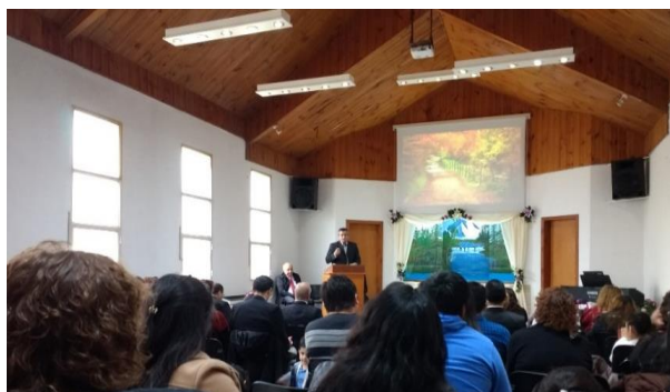
Servicio de “culto divino” en el templo adventista en Caleta Olivia.

Apenas dicho esto, varios de los asistentes tomaron en sus manos biblias que habían llevado consigo al templo, y comenzaron a revisar sus páginas. El orador, entonces, leyó en voz alta el pasaje al que se refería y retomó su exposición. Algunas frases que se repitieron con frecuencia durante su discurso fueron: “quién será salvo”, “Dios nos da la salvación (...), está en nosotros el elegirlo”, “tenemos que seguirlo a él” y “tenemos que estar conectados con Cristo” (Caleta Olivia, 29 de abril de 2018). Ya eran las 11:30 de la mañana, y la voz del orador y el estilo de su presentación comenzaban a transmitir cierta monotonía, por lo que varios de los asistentes se mostraban aburridos; algunos comenzaron a hablar entre sí por lo bajo y, especialmente los niños, empezaron a ponerse inquietos en sus lugares.