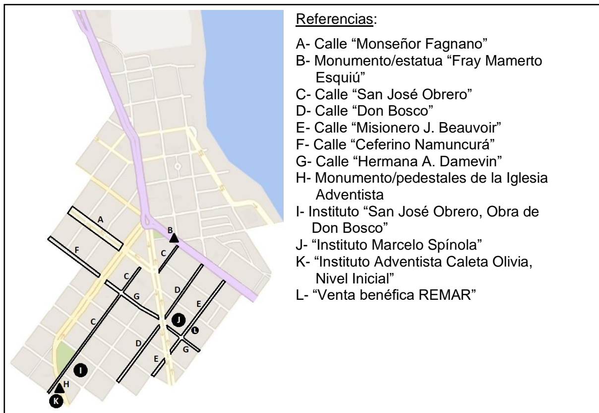
Ubicación de instituciones, monumentos y nombres religiosos de calles en el área central de Caleta Olivia. Mapa usado bajo licencia de "© Colaboradores de OpenStreetMap" y modificado por G. Zoppi.

por ejemplo, nombres 1 de comercios y establecimientos que revestían connotaciones religiosas. La mayoría de ellos tenían relación con la tradición cristiana, aunque no se los pudiera vincular directamente con una denominación religiosa en particular 2 . También podían observarse nombres claramente católicos 3 e incluso algunos otros no cristianos 4 , derivados del orientalismo o New Age.