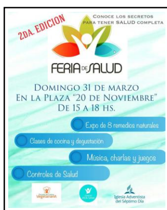
Afiche de invitación para la “feria de salud” que llevó a cabo la Iglesia Adventista de Caleta Olivia en marzo del año 2019

También puede destacarse en este sentido que, a modo de ejemplo, entre los años 2017 y 2019 la IASD en Caleta Olivia llevó a cabo diversas acciones de servicio comunitario: una iniciativa para recolectar productos de limpieza, agua mineral y alimentos no perecederos con el fin de distribuirlos entre los damnificados por el temporal que asoló la ciudad vecina de Comodoro Rivadavia a fines de marzo de 2017; la promoción y el desarrollo de una jornada de donación voluntaria de sangre para el hospital local en junio de 2018, y la realización en 2017 y 2019 de dos “ferias de la salud” dirigidas a la comunidad, 1 en las que se brindaron clases de cocina saludable, charlas de salud y controles gratuitos de presión arterial, glucemia y aptitud física.