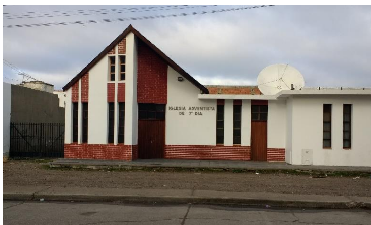
Vista exterior del templo adventista en Caleta Olivia.

manera parecida a como habíamos decidido vestirnos nosotros; ellas nos saludaron con amabilidad y nos entregaron un pequeño volante con algunas informaciones relativas a las actividades que tenían lugar en la iglesia. Avanzamos unos metros más, cruzamos un par de puertas de vaivén e inmediatamente nos encontramos en el interior del templo. Numerosos asistentes ocupaban sillas dispuestas en círculos que formaban seis grupos, constituidos por unas diez a quince personas, que se repartían a lo largo de todo el salón. Nos dirigimos entonces al primero de esos grupos, a nuestra mano derecha, y nos sentamos.