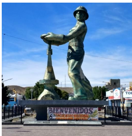
Monumento al Obrero Petrolero.

Un primer intento de poner en orden tantas impresiones juntas nos había conducido a visitar la Oficina Central de Informes, ubicada frente al “corazón” de la ciudad: el Monumento al Obrero Petrolero o, al decir de los propios caletenses, “El Gorosito”. 1