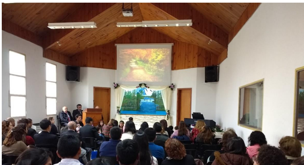
Interior del templo adventista de Caleta Olivia durante el comienzo del “culto divino”.

Entonces, este tipo de observaciones nos permiten volver a verificar, en los hechos, el modo en que las creencias operan configurando los marcos de referencia y la identidad del grupo. Aparte de reflejarse en su organización institucional y sus ideales, como observamos en el capítulo anterior, el sistema doctrinario adventista y la cosmovisión que modela también acaban concretándose en la constitución física de sus templos, sus formas y mobiliario.