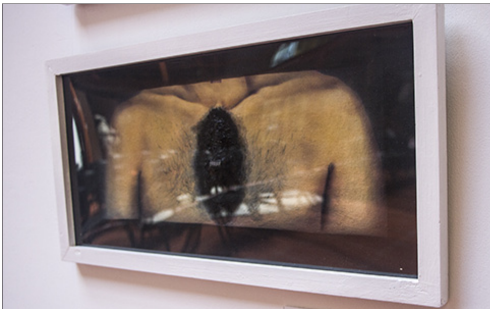
El retorno del olvido se encuentra en el corazón | Gabriel Sasiambarrena