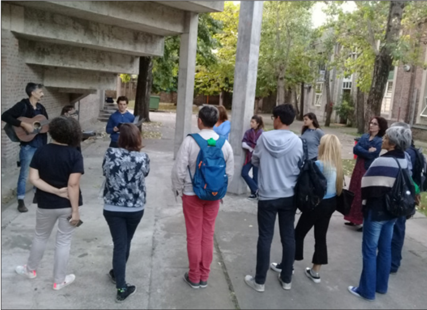
Relato situado: UNQ tiene memoria | Compañía de Funciones Patrióticas