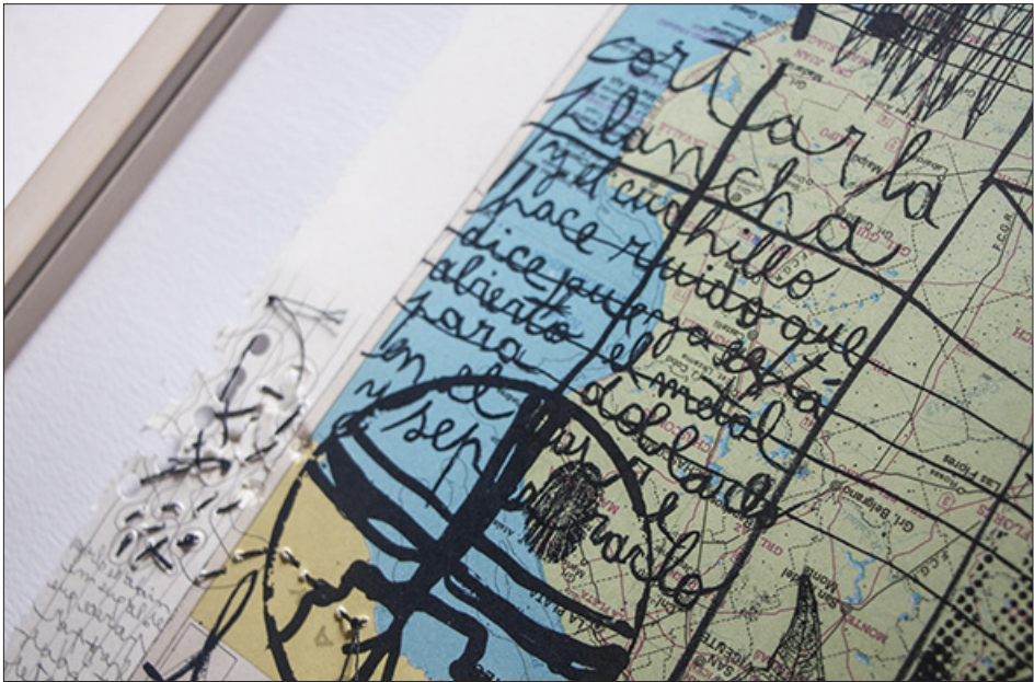
Sin título | Pablo Delfini