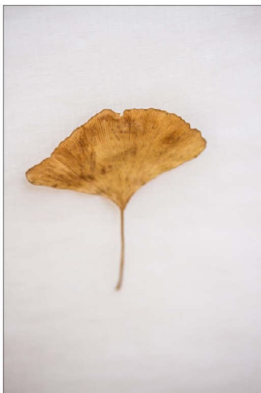
Palabras duermen en semillas (de quebracho blanco) | Laura Andreoni