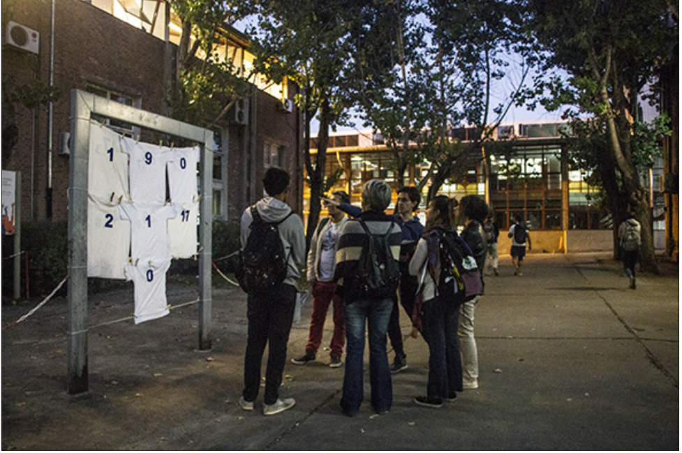
Relato situado: UNQ tiene memoria | Compañía de Funciones Patrióticas