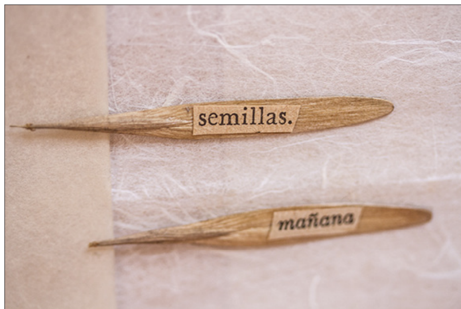
Palabras duermen en semillas (de quebracho blanco) | Laura Andreoni