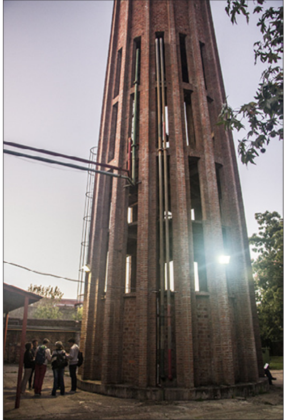
Relato situado: UNQ tiene memoria | Compañía de Funciones Patrióticas