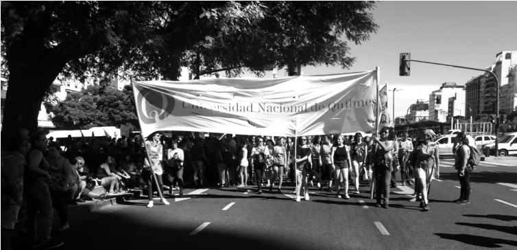
La UNQ presente en la marcha del 8 de marzo de 2018 8 . Fuente: UNQtv – Programa de Producción Televisiva de la UNQ.