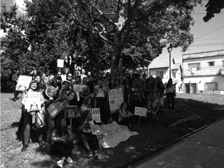
Camino a la marcha del 8 de marzo de 2019. La fotografía muestra la articulación con estudiantes, docentes y PAS (personal administrativo y de servicios) de la universidad.

Posdata: Cuando afirmábamos que la recuperación sería difícil ni en los peores escenarios estaba la pandemia mundial de la COVID-19.