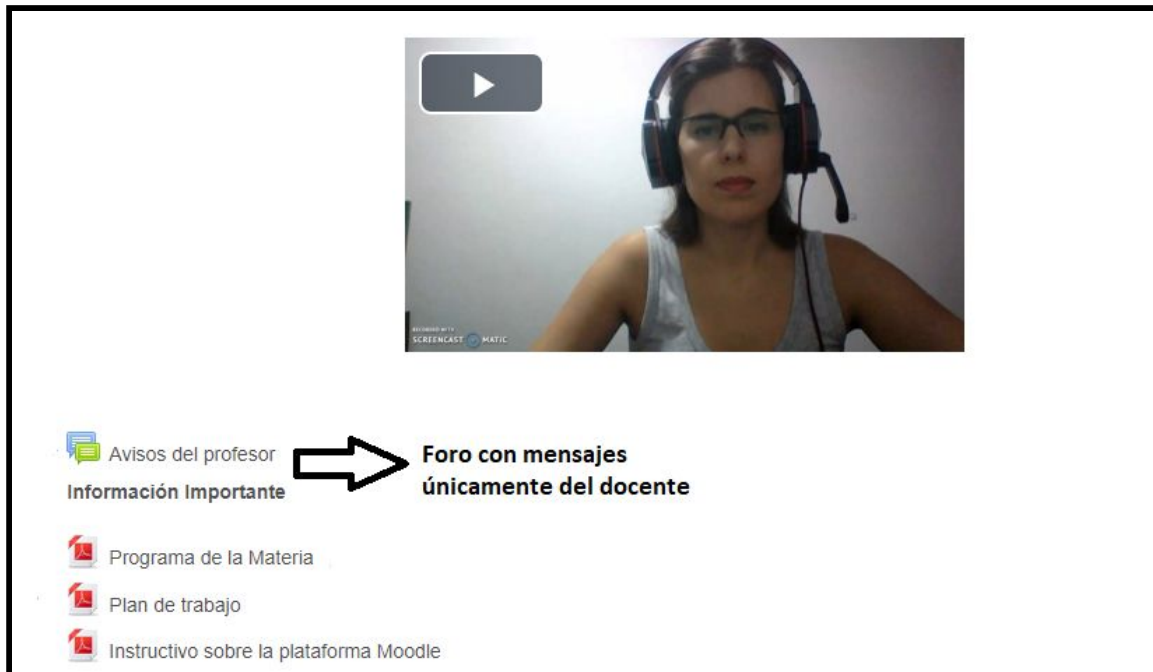
Figura 2: información importante.

La figura 2 muestra el foro “avisos del profesor” donde el docente enviará todos los mensajes sobre cuestiones importantes a lo largo del cuatrimestre, por ejemplo cuando se encuentre habilitada cada una de las clases, los encuentros sincrónicos para recordarles que día y horario son, información sobre jornadas dentro del Departamento de economía y administración que puedan ser de su interés , entre otras.